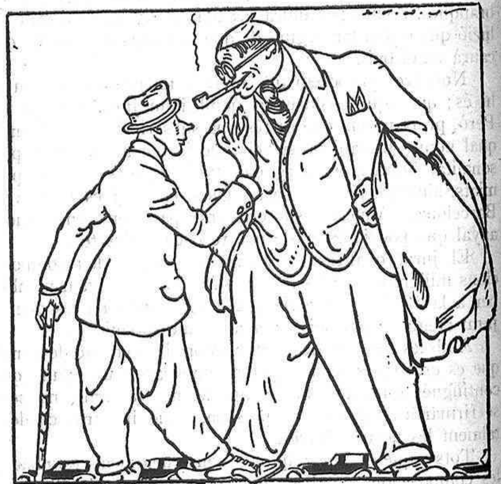
UNA NOTICIA INTERESSANT

L'altre. —Fins quan l'obra per a fer un badall?