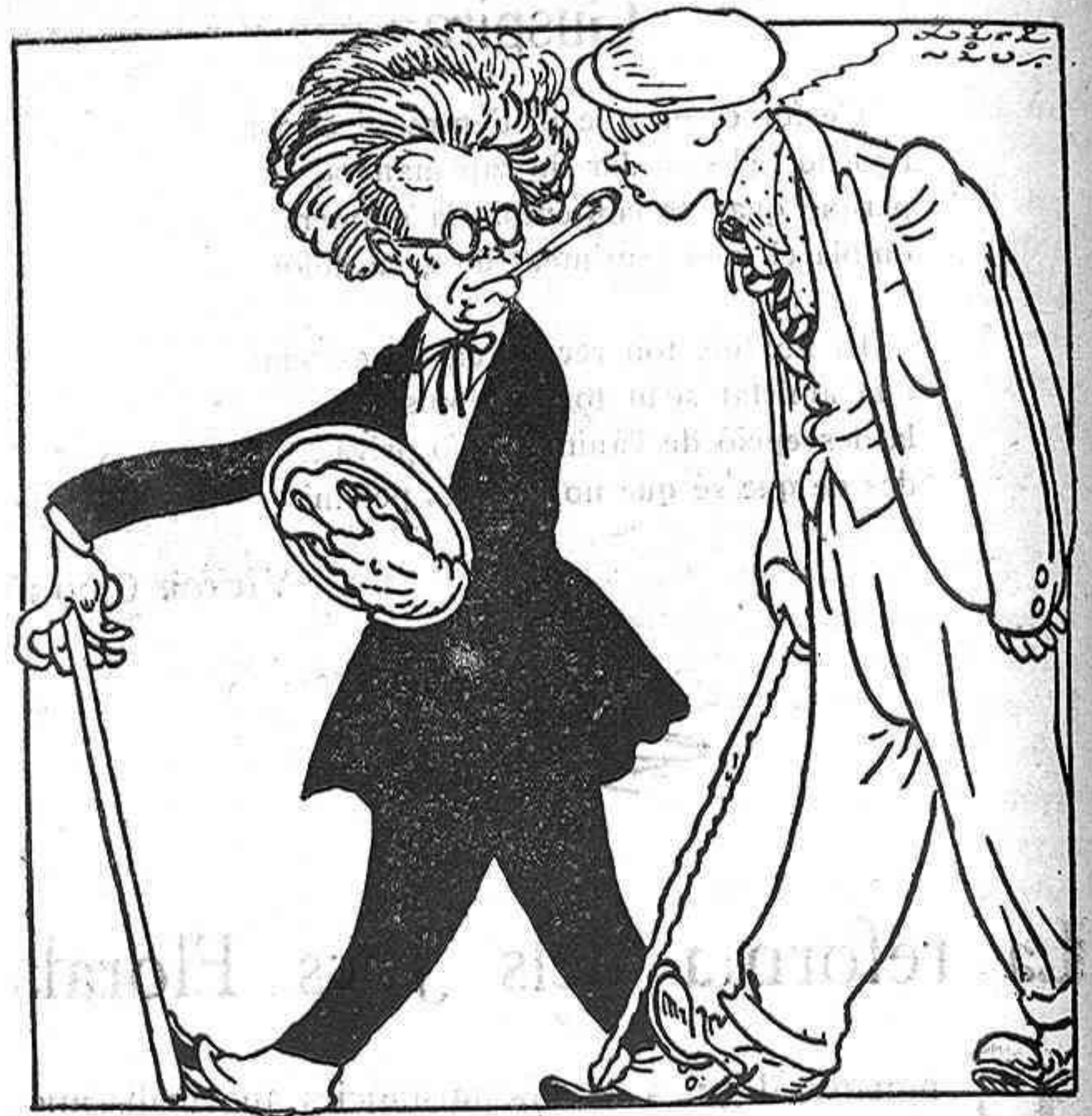
UN HOME D'IMPORTÀNCIA

Vosaltres dos sou l'arbre de la vida prop de la mort. Per xò resta esllanguida l'horta que reia sempre exuberant, l'horta que em guarda tants records d'infant.