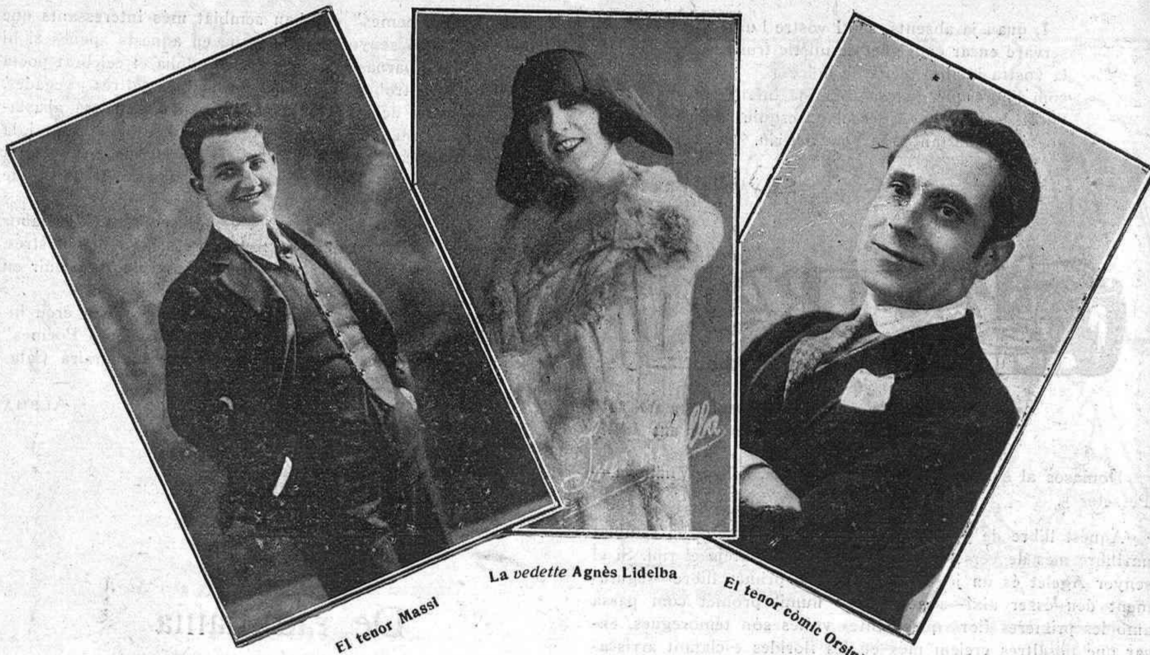
El tenor Massi