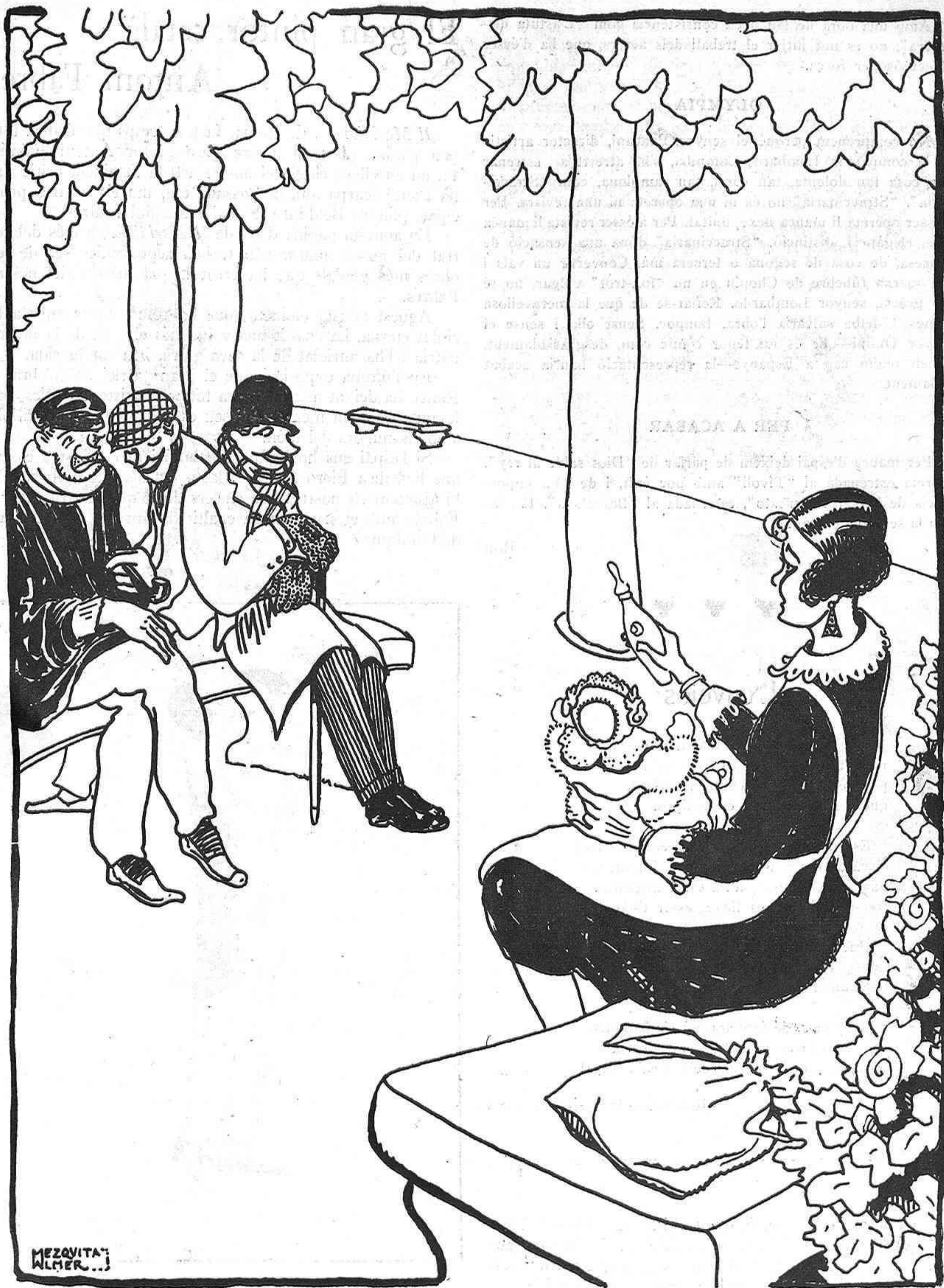
EL RETORN A LA INFANTESA