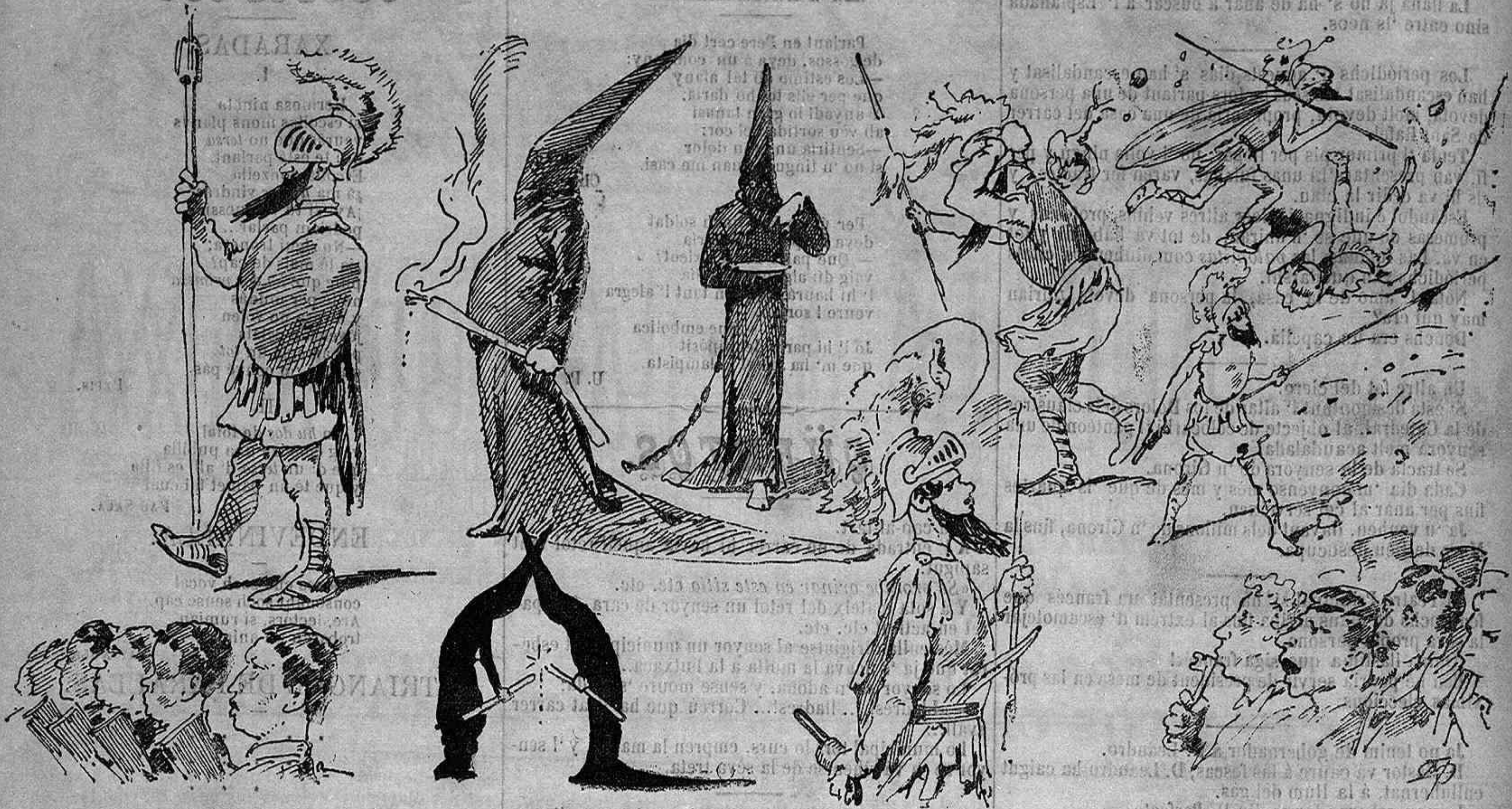
Croquis de Professó.