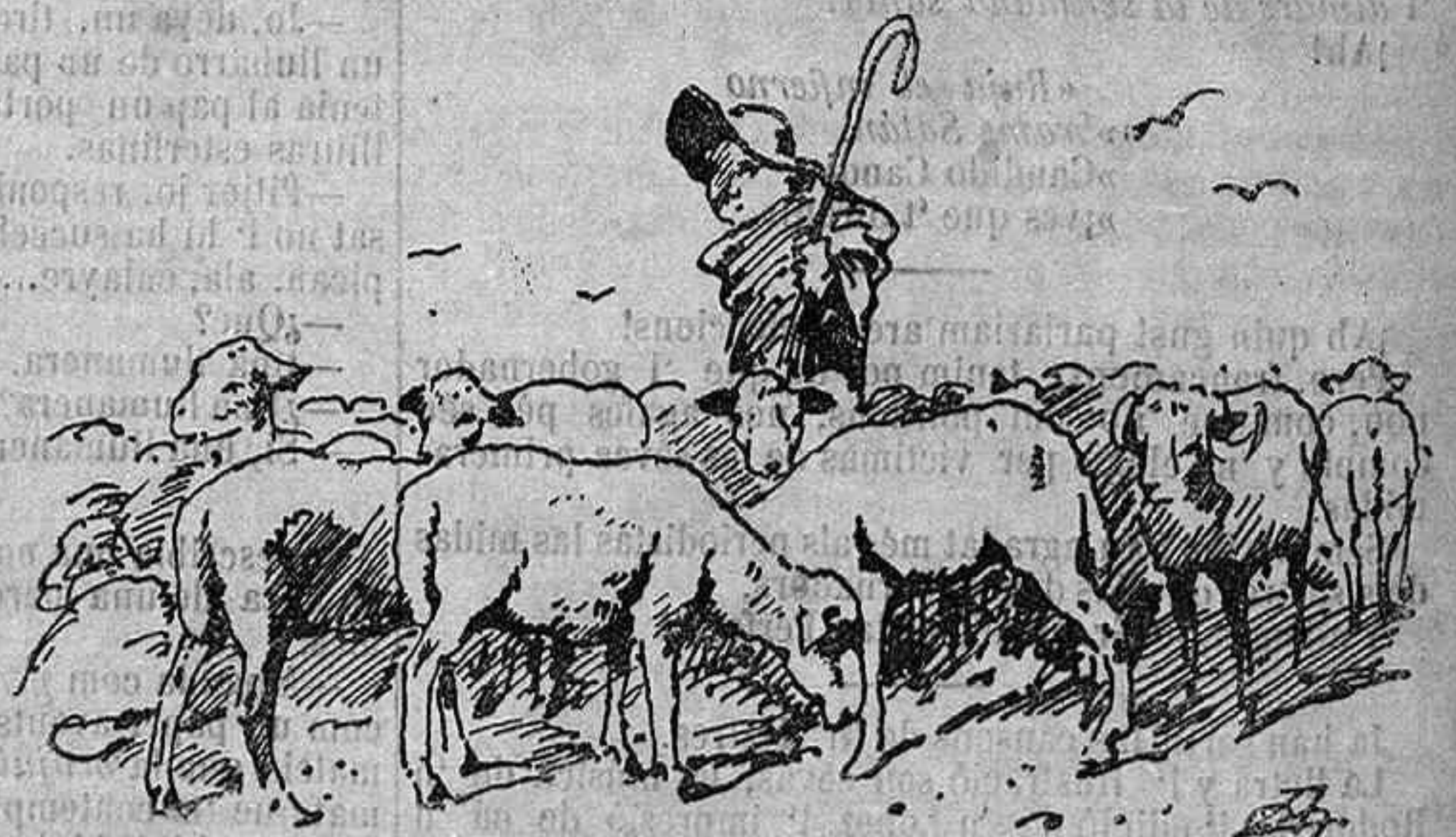
Aixís s' ha acabat tot: ab llana.