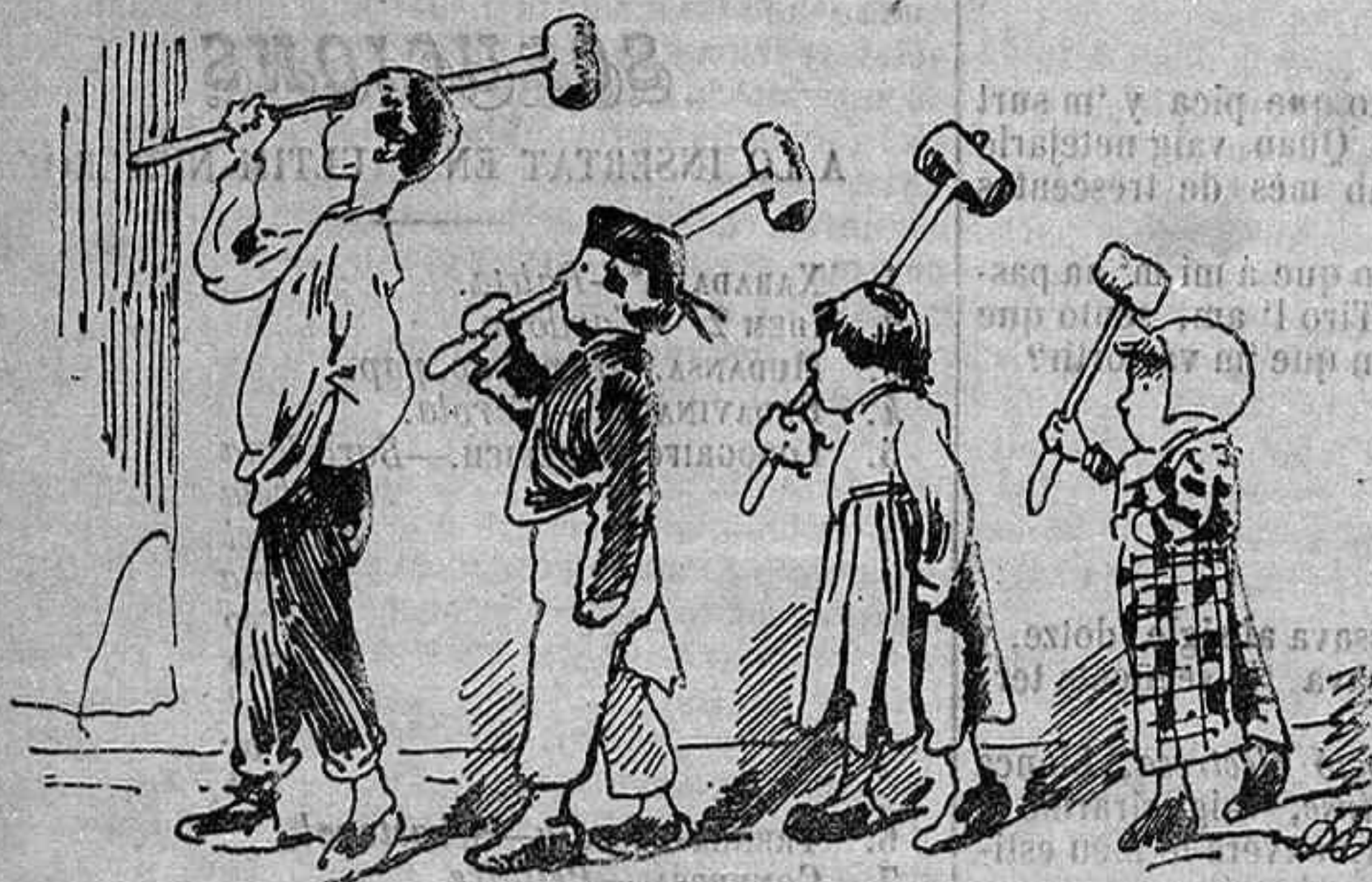
Apesar de las ordenansas municipals los fidels no han faltat á la tradició.