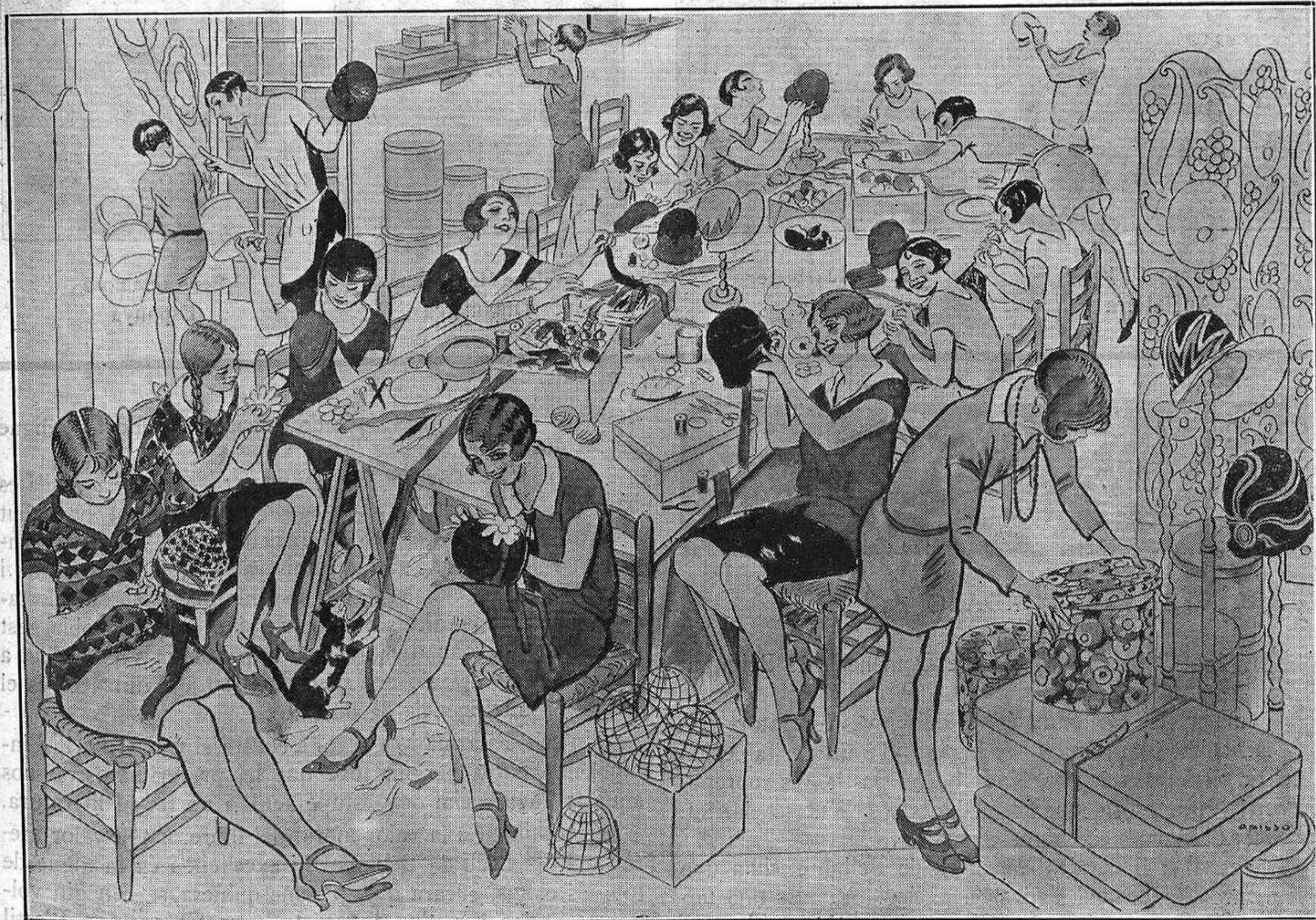
EL BALL DE LES MODISTETES BARCELONINES

Bocet de la decoració que adornava el teatre on tingué lloc el ball de les nostres modistetes, pintat pel nostre dibuixant Ricard Opisso.