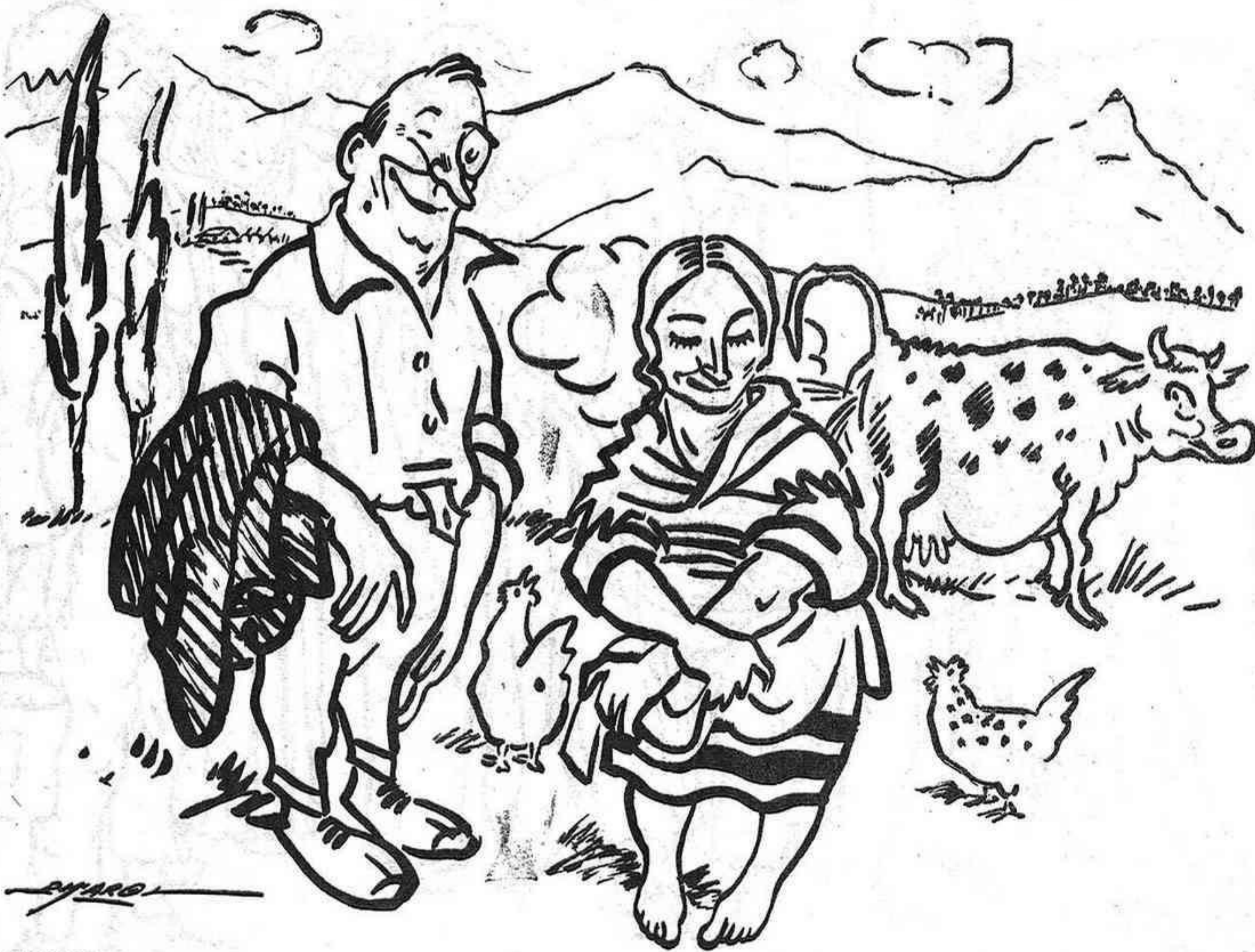
IDIL·LI AL CAMP

Ella. — No sé com disfressar-me que no em coneguin. Ell. — Molt senzill; perfumat, i no et coneixeran.