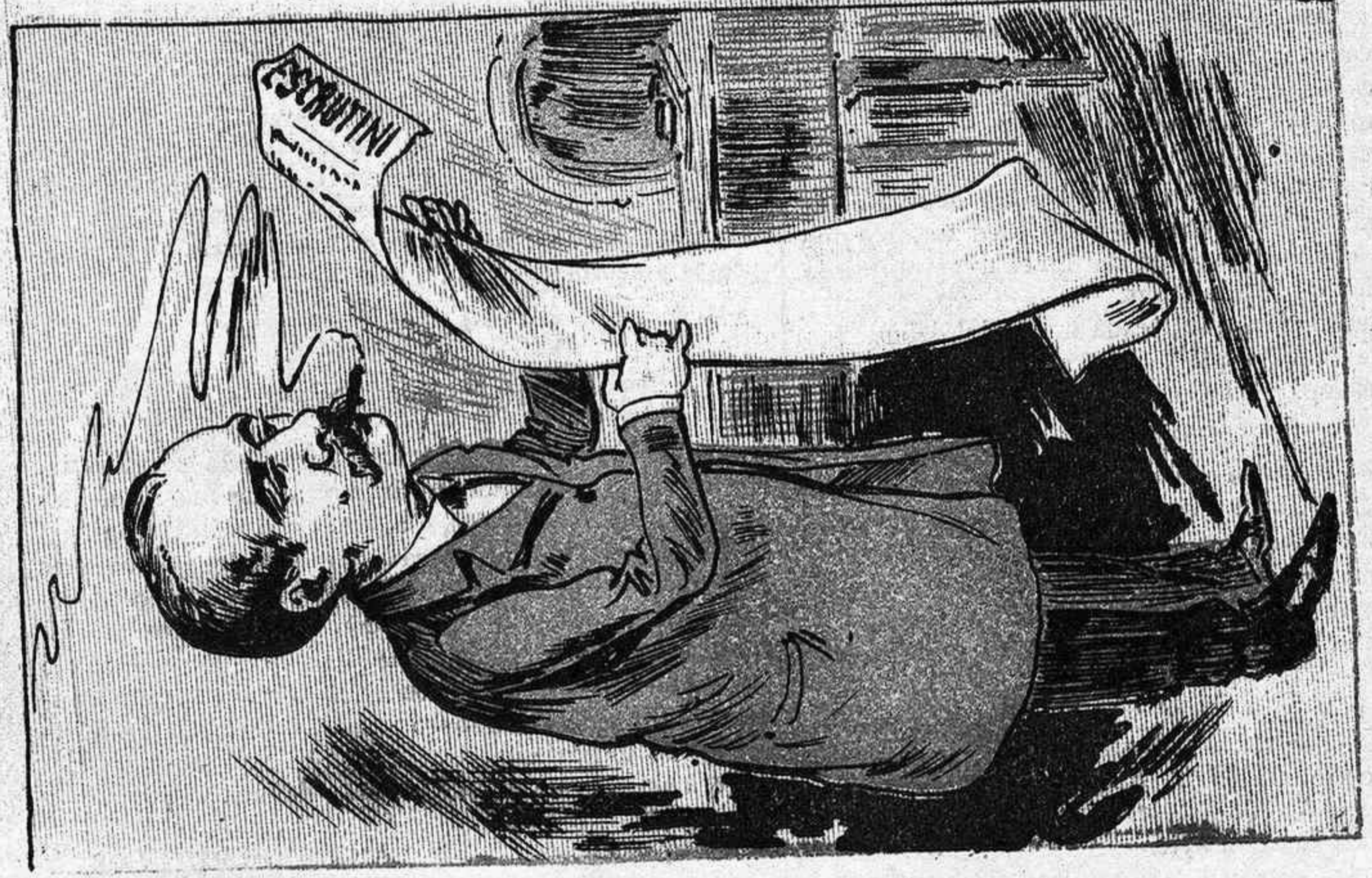
El caequillo ministerial ha trobat ab estupefacció que aquesta vegada ja no l' hi surten eis comptes.