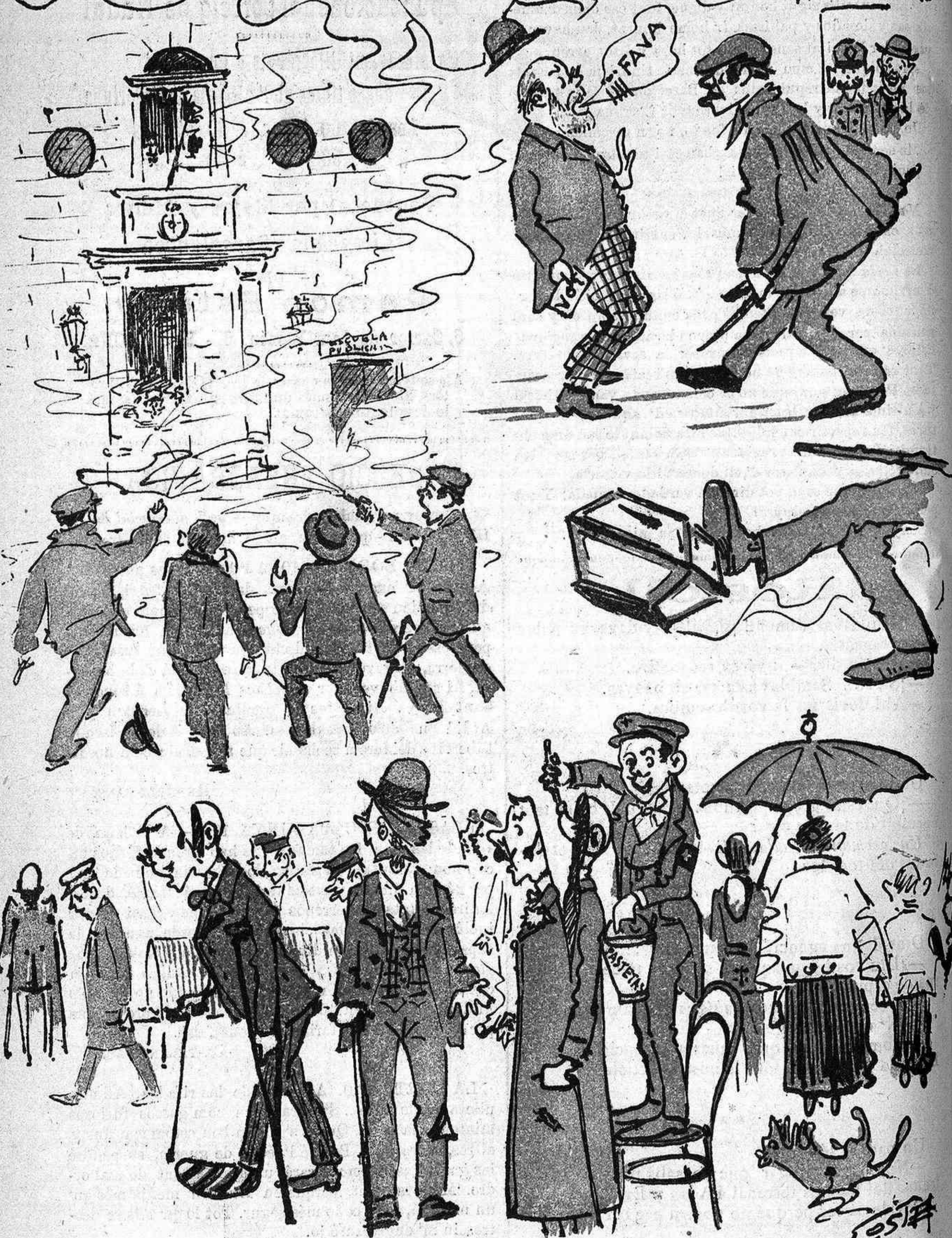
Tiros, garrotadas, llenya, atropells á discreció per eix sistema s' ensenya qui es honrat y té rahó.