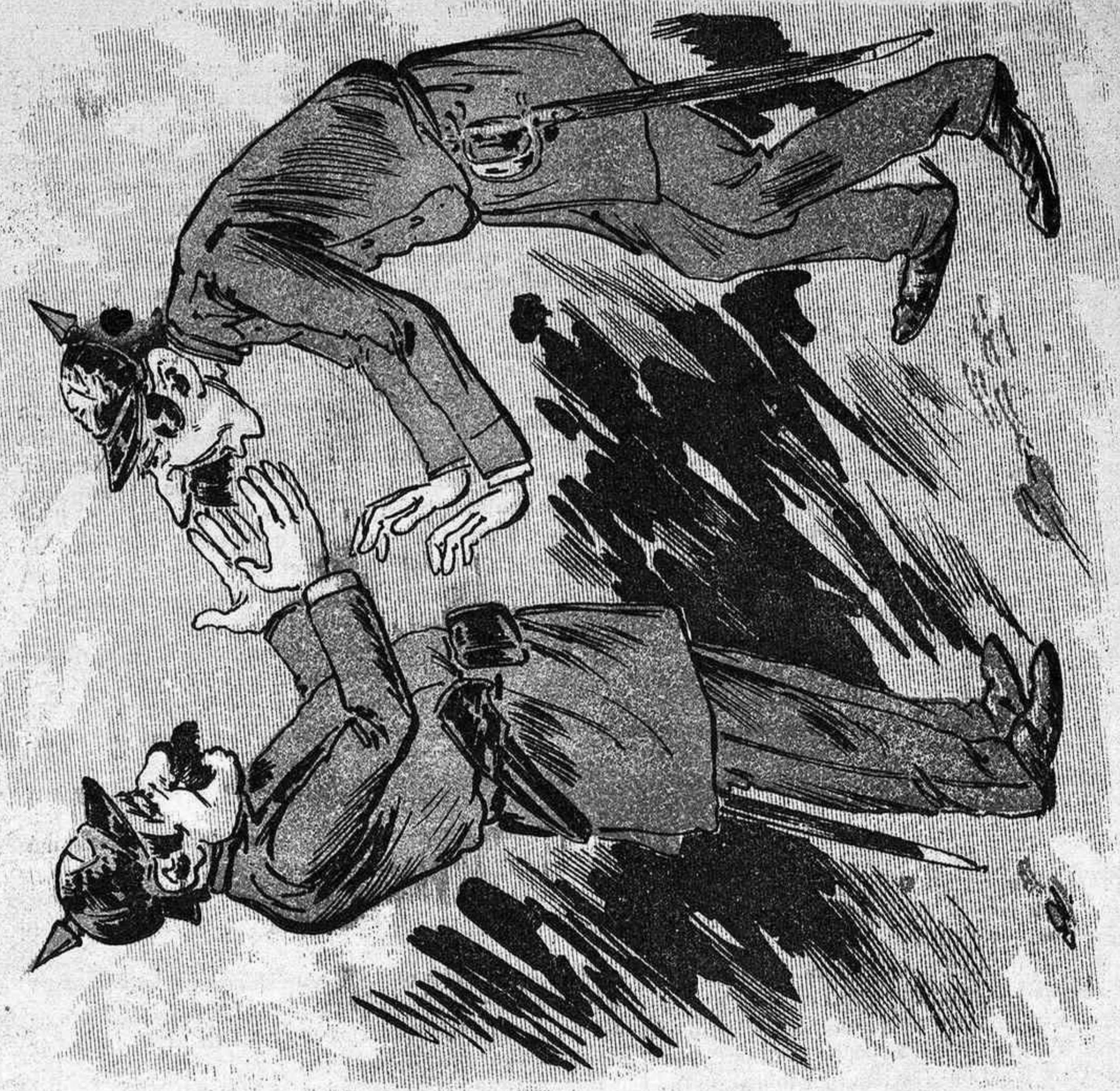
—¡Ay Lopez! Ja nos podemos amanir! —Y eso, ¿porqué, Guiterrez? —Porque los concijales notis no van á dejar ni un solo castellanot en el Municipio!