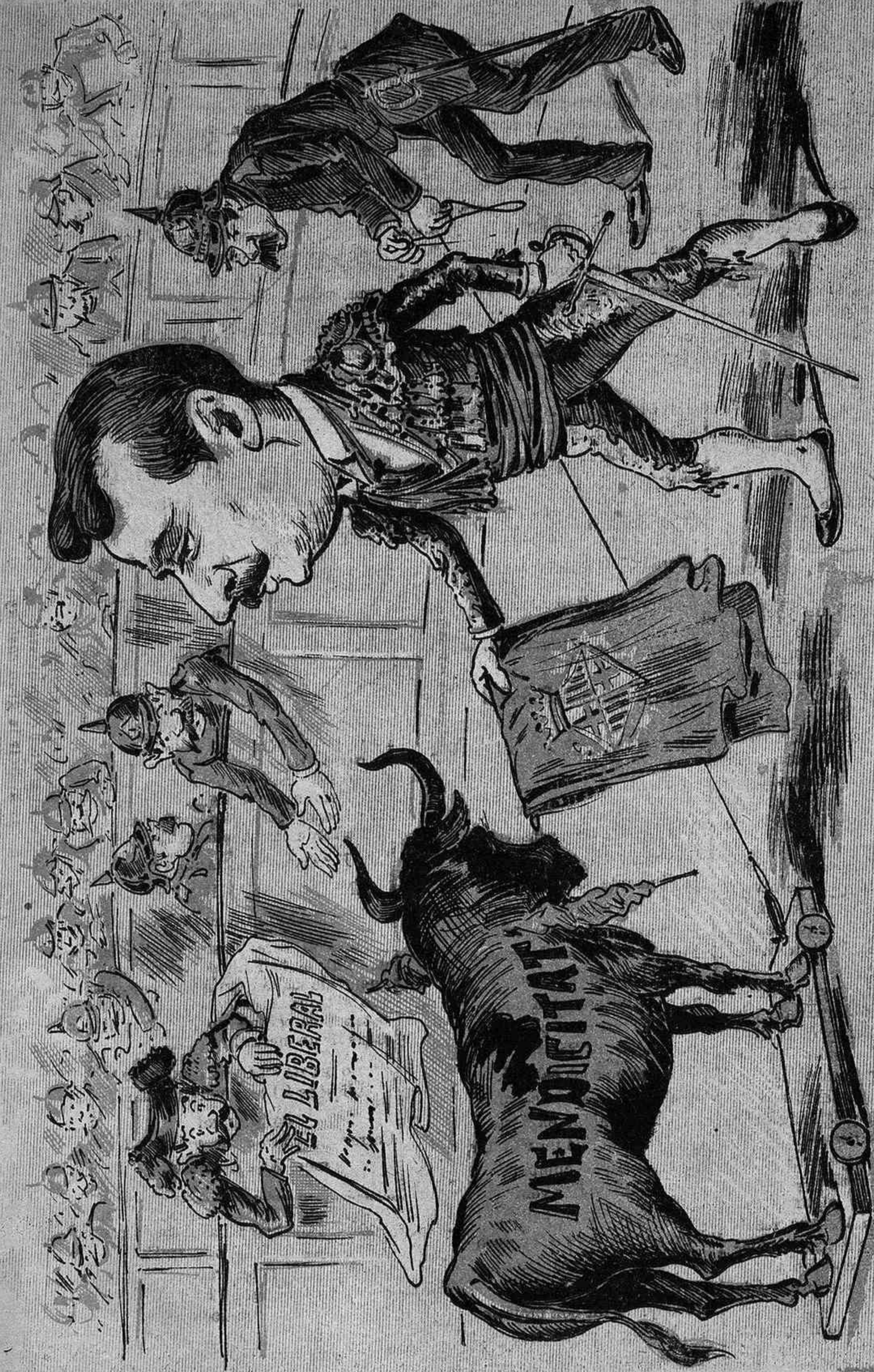
Invitat pel "Liberat" diumenge, si es que no plou, ja veurán a las Arenas com l' Arcalde hi mata un bou.