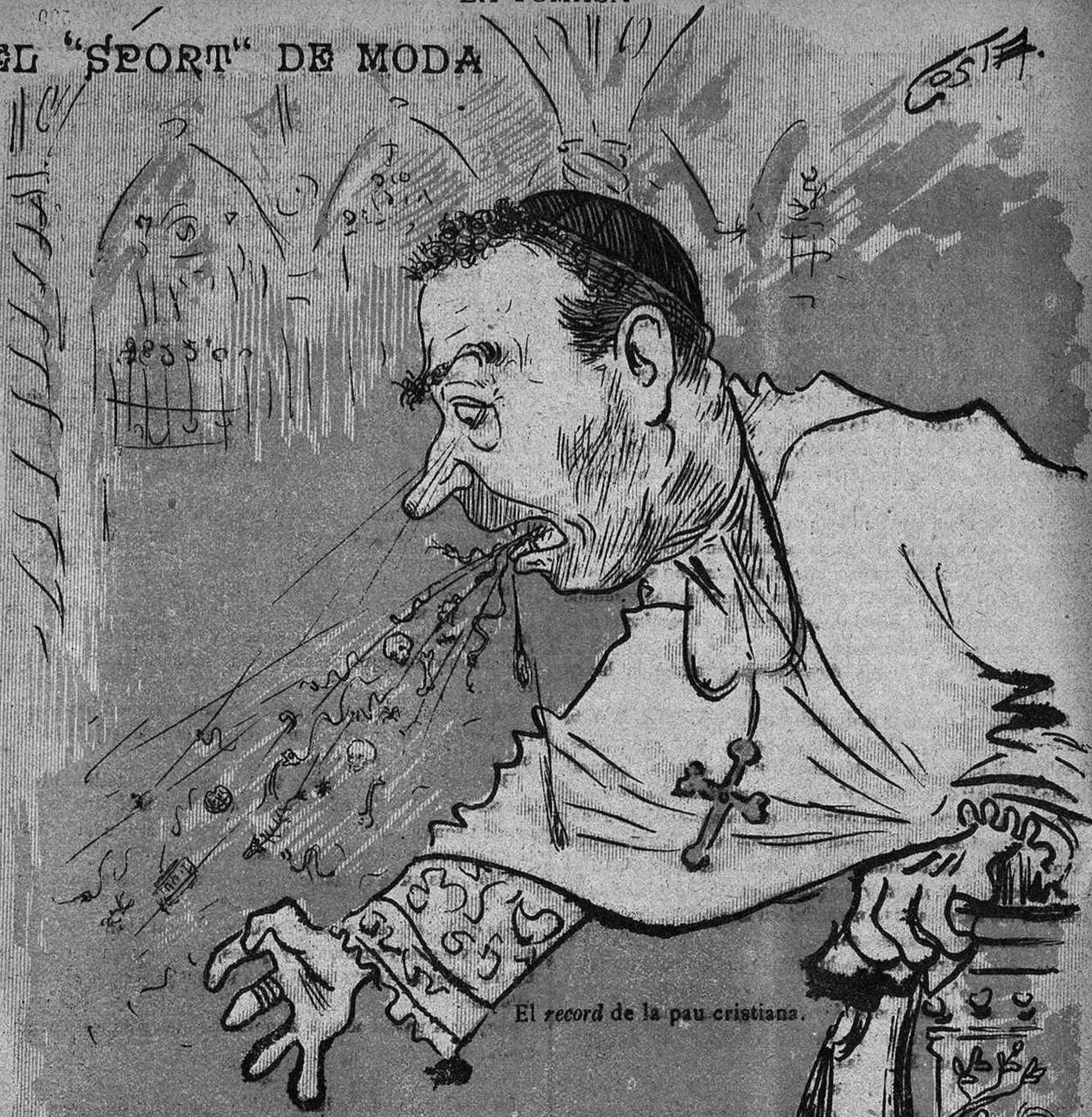
El record de la pau cristiana.