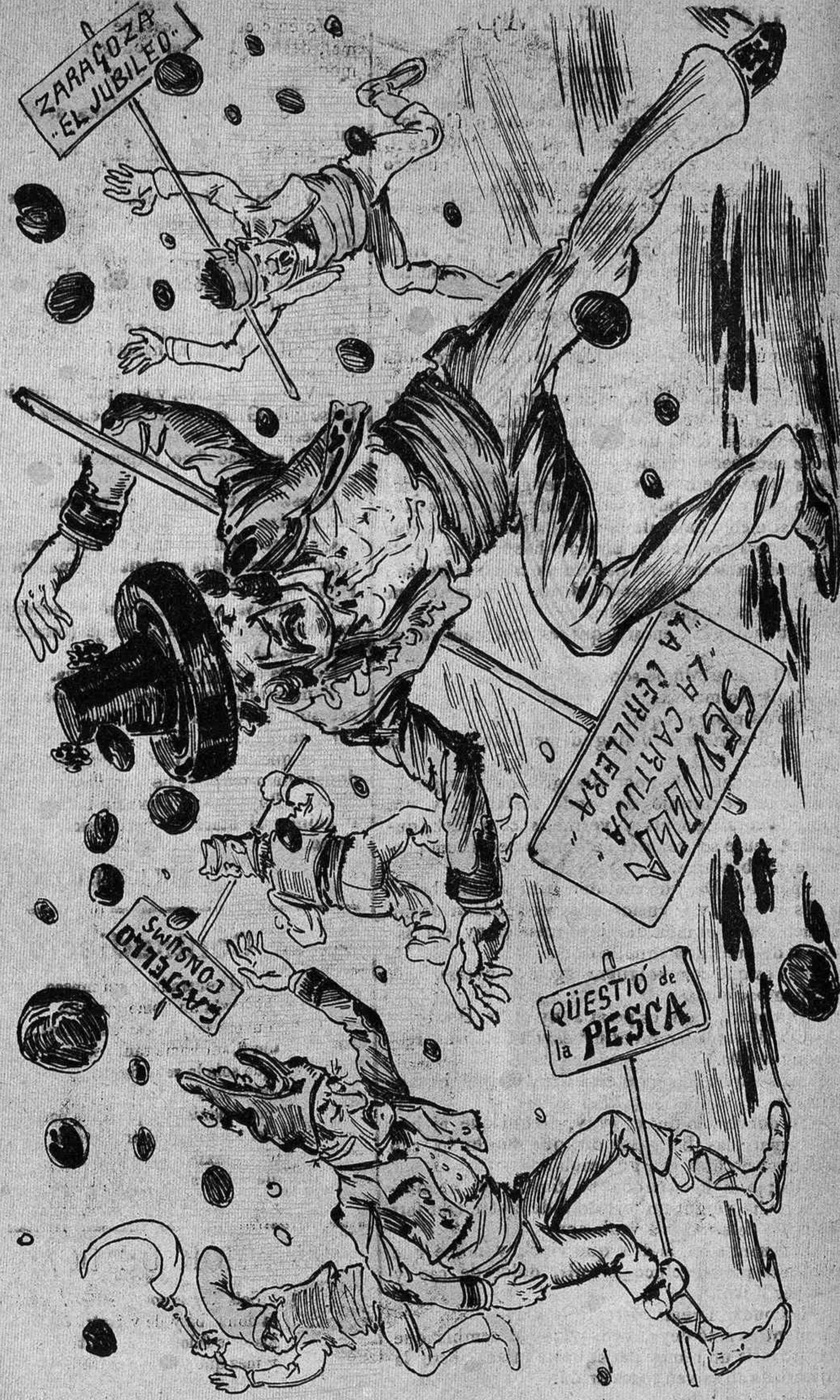
En moltes regions d' Espanya pel sol fet de protestar ja hi peta la gran castanya.