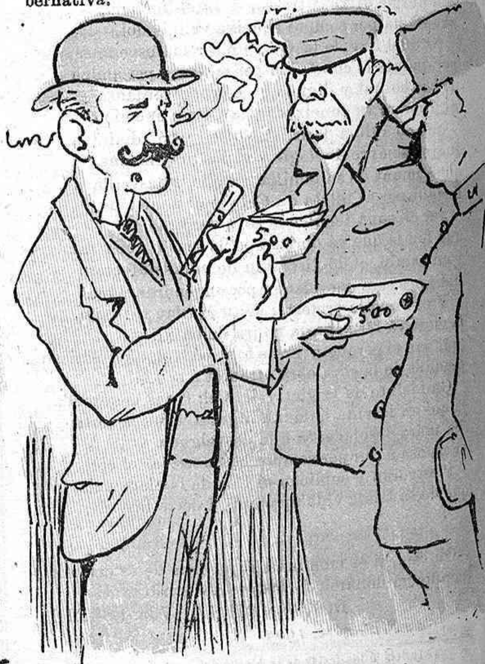
Y 'ls sous mes baixos pera premiar tals serveys, serán de 500 pessetas mensuals.