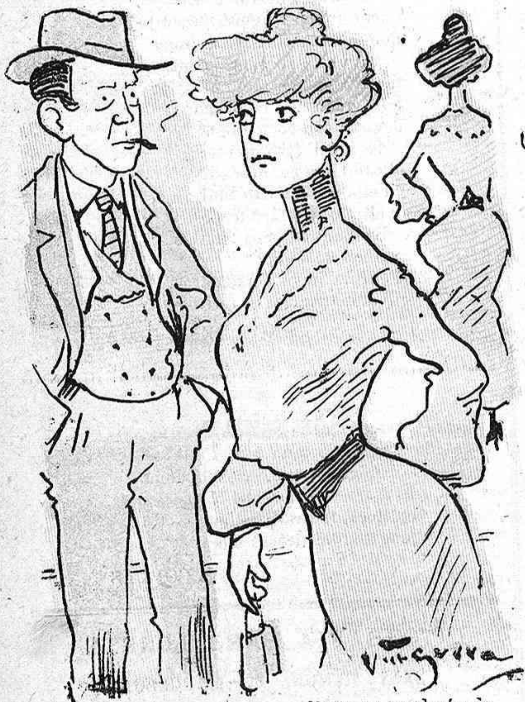
Los bagarros més acreditats, se cuydarán de la higiene.