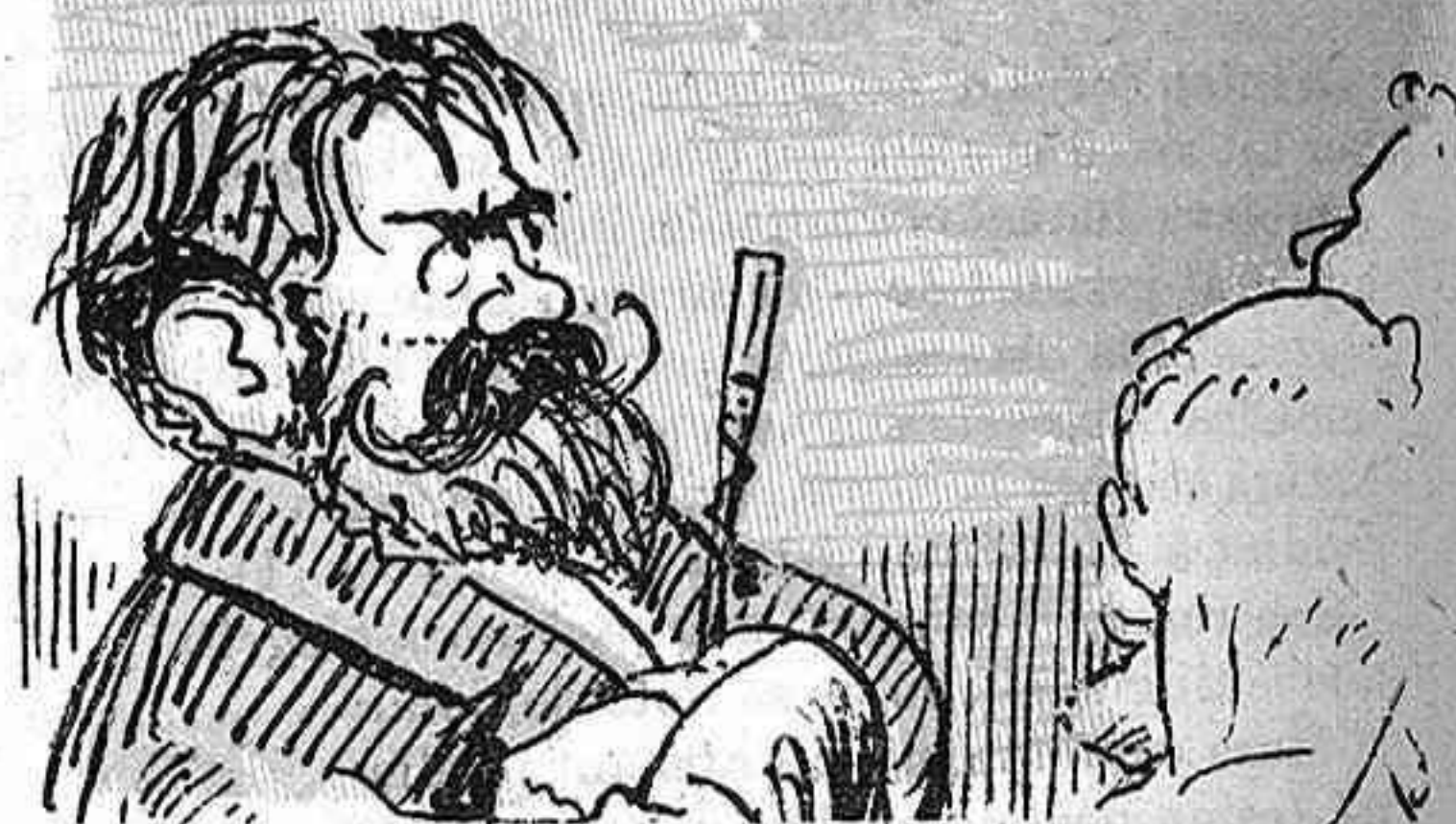
Los més furibundos dinamiteros, asistirán als meetings en delegació de la autoritat gu- bernativa.