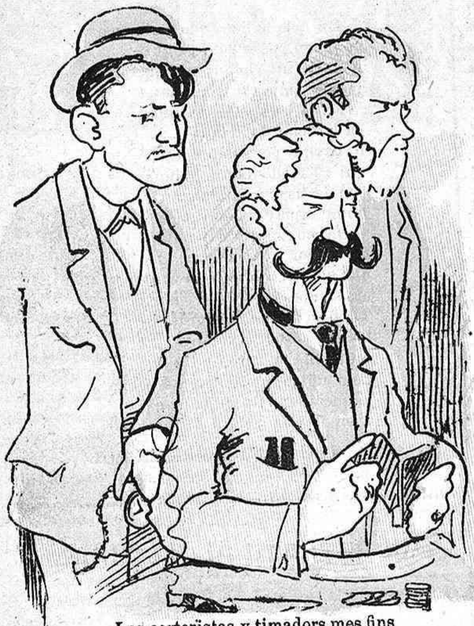
Los carteristas y timadors mes fins vigilarán las casas de joch.