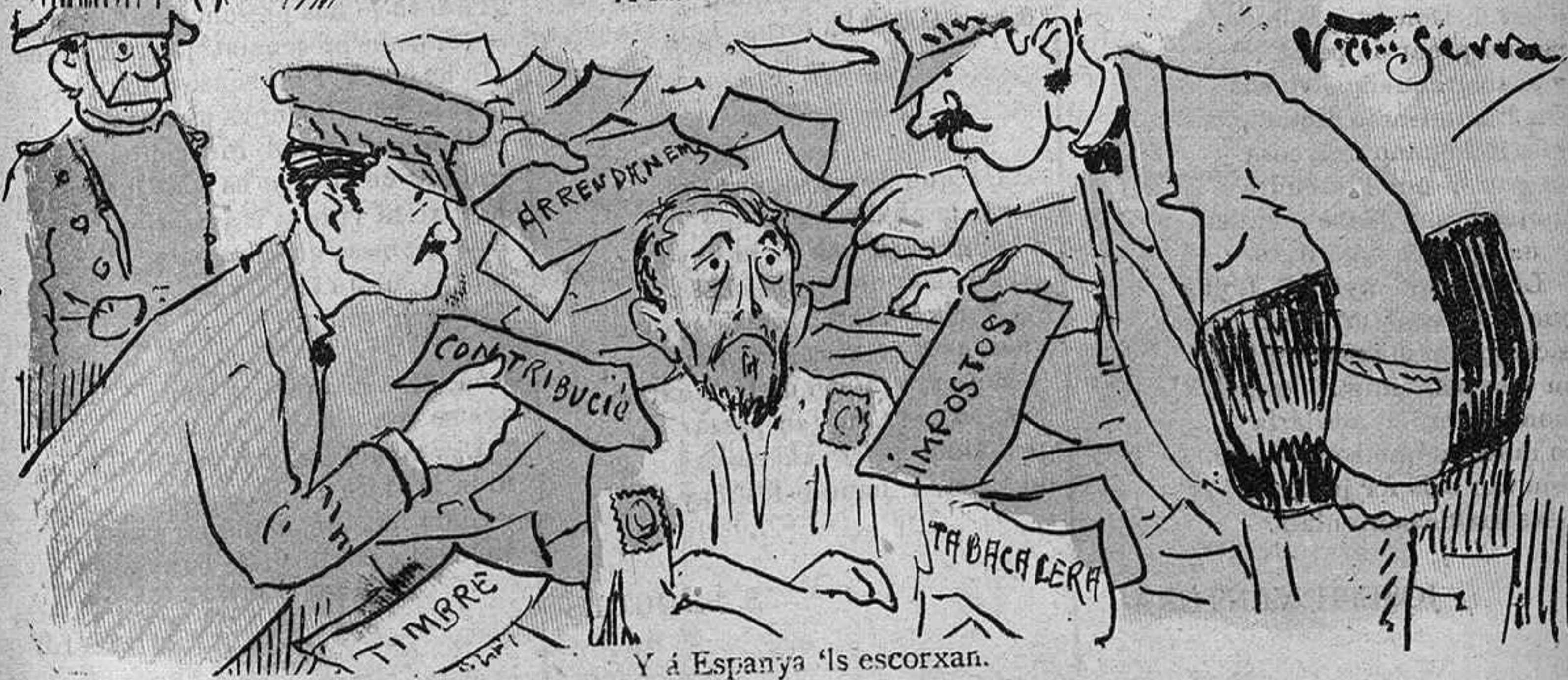
Y á Espanya 'ls escorxan.