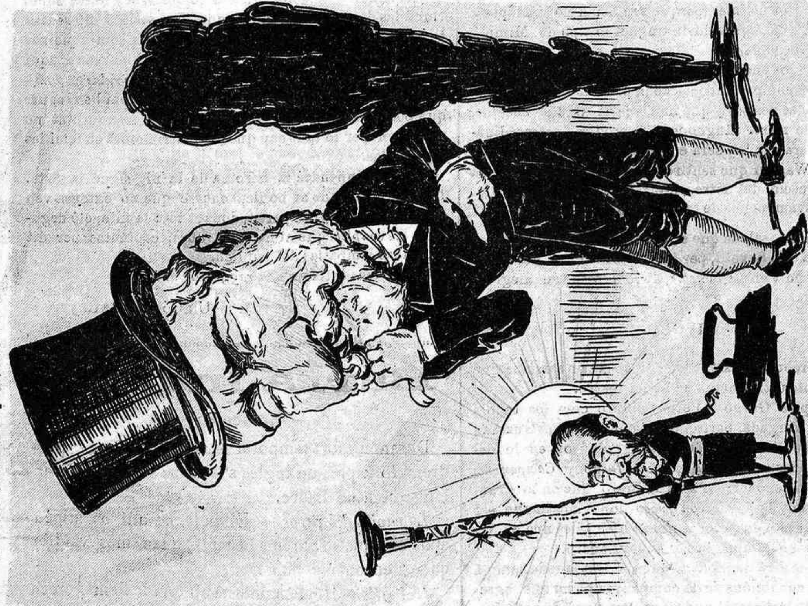
Are la profecia ho pinta aixís. ¿Se cumplirà? Ja ho veurém. Lo que s'pot assegurar es que el Gran Cacich rescobra las proporcions y las pantorrillas. Y l'altre s'arronsa.