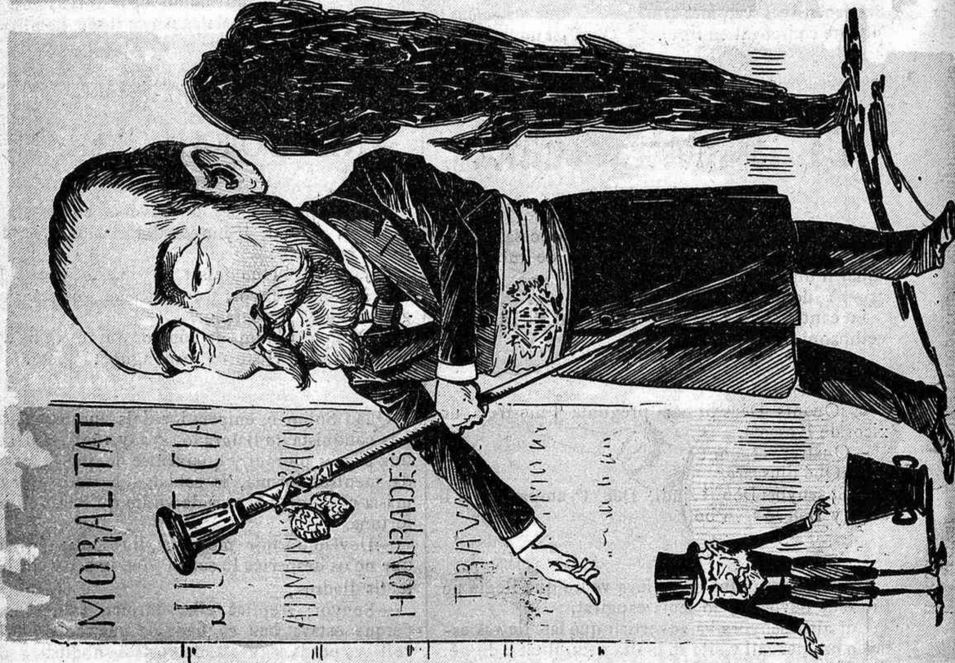
Las primeras embestidas del doctor Rot — vert foren de gegant. En cambi, l'altura del Gran Cacich s'anava encongint fins arriivar á las mínimas proporcions d'un tupinet. Ni se li coneixian las pantorrillas.