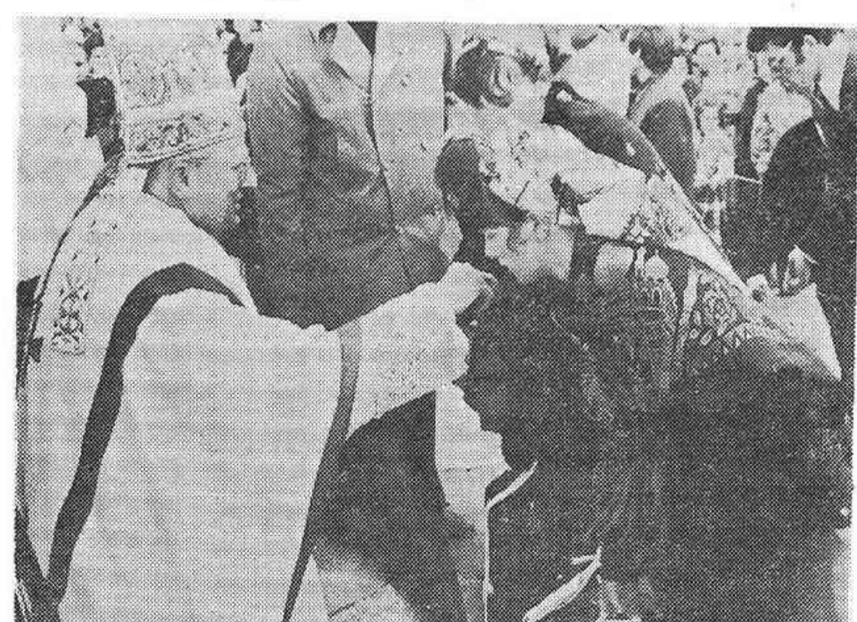
El señor Obispo, recibiendo la ofrenda de una de las representantes de los pueblos

zo la misa, en un altar instalado en la explanada que existe frente al templo, oficiando en la misma