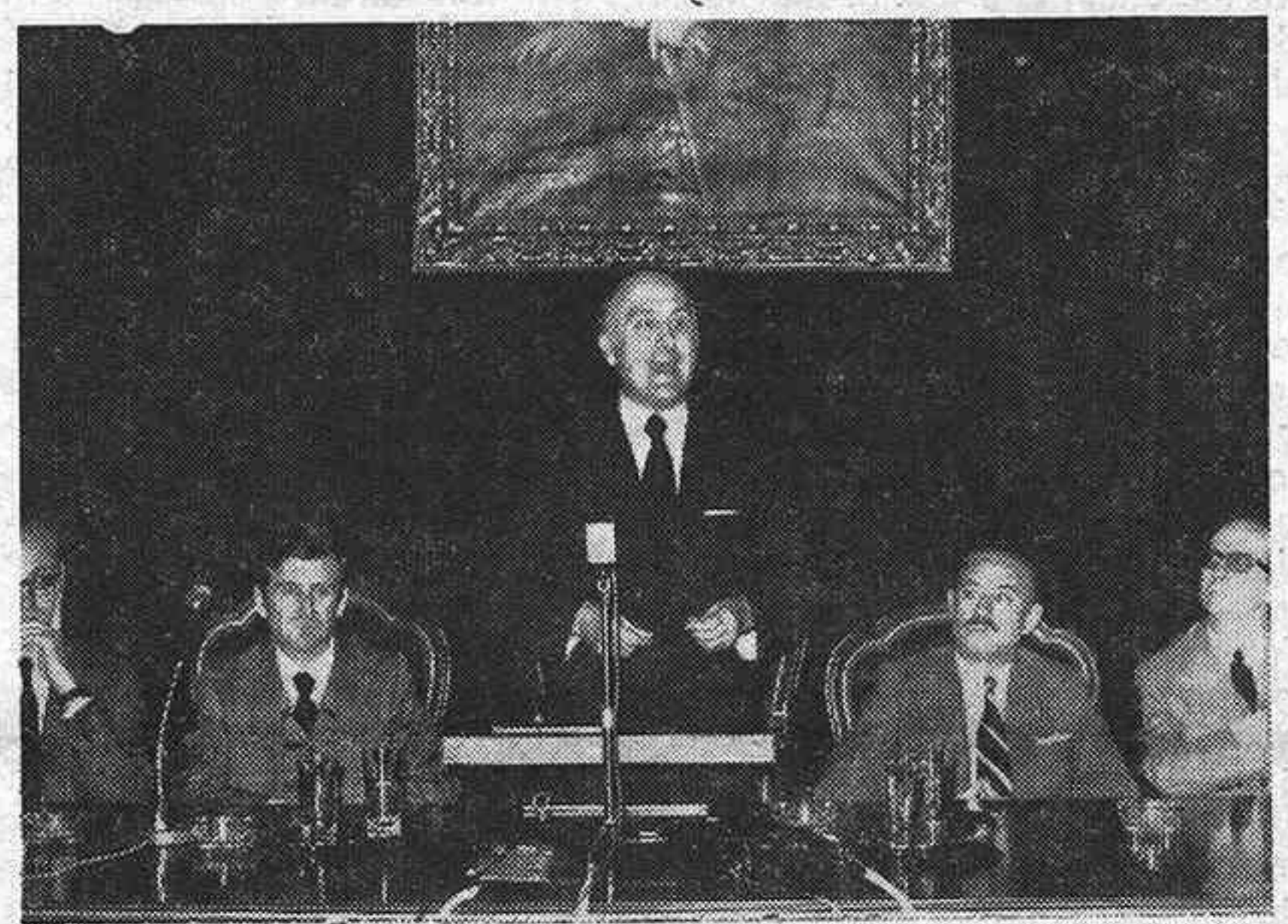
El Ministro durante su discurso.

El ministro, el gobernador civil, el presidente de la Diputación, el director general de Promoción Social, el alcalde de Guadalajara, el jefe de protocolo del Ministerio, y el magistrado de la Audiencia, señor Crespo. El primero en hacer uso de la palabra fué el señor Colme-