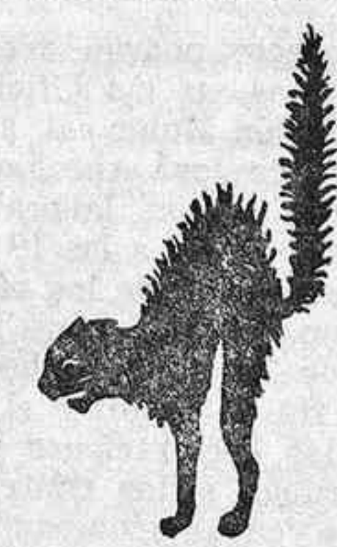
esta profunda mutación.

de hoy, y a ellos hay que buscarles solución, aunque no sean ni lo pedagógicas, ni lo rigurosas, ni lo correctas que todos deseáramos. Peor es el «desempleo» para alumnos y maestros; peor el que haya en una clase el treinta o el cuarenta por ciento más de los que debería para un trabajo serio y eficiente. Peor, mucho peor, que la formación de estas nuevas promociones --sobre las que se está ensayando una verdadera revolución educativa--, pueda distorsionarse o comprometerse con problemas de mucho menor rango que los que ha venido a plantear