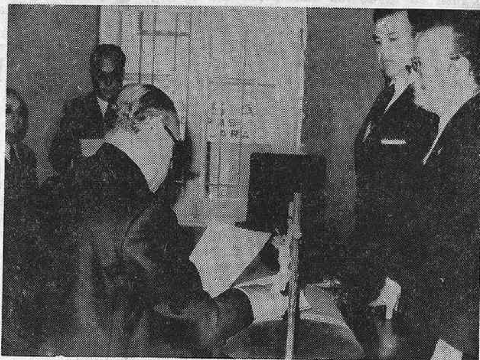
Juramento del nuevo Presidente del Tribunal.