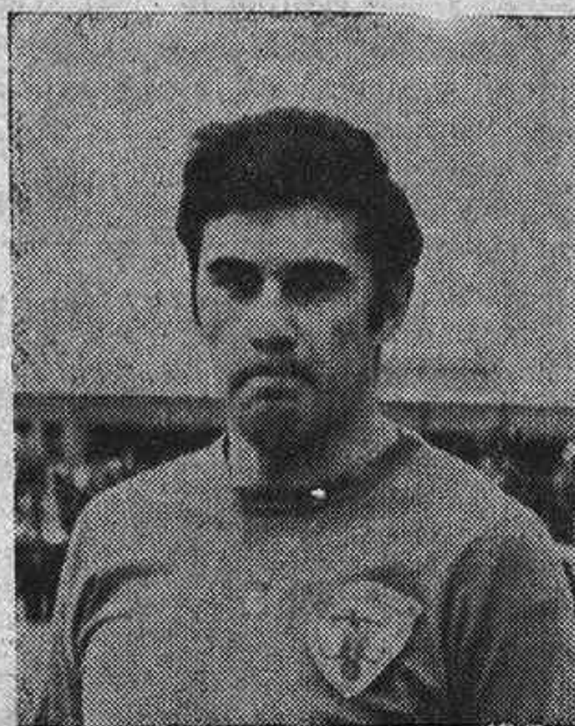
FRANCISCO. De nuevo puso de manifiesto su gran clase, cuajando una gran actuación frente al Salmantino.

venido a ser una repetición del jugado ante el Moscardó, ya que el Deportivo se ha impuesto completamente en la primera mitad, en la que ha merecido conseguir dos o tres goles, con su juego rápido, abierto y espectacular, en el que los tres delanteros permutan sus puestos, desorientando a la defensa enemiga, que no tiene nunca enfrente al clásico delantero centro