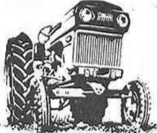
R-500 B - 52 CV HMA