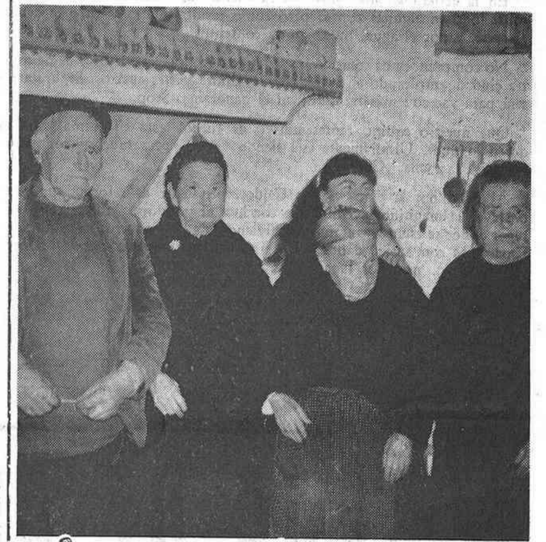
La centenaria, acompañada de algunos de sus familiares.

—Se ha puesto muy contenta y lo ha agradecido mucho. A nosotros también nos ha agra-