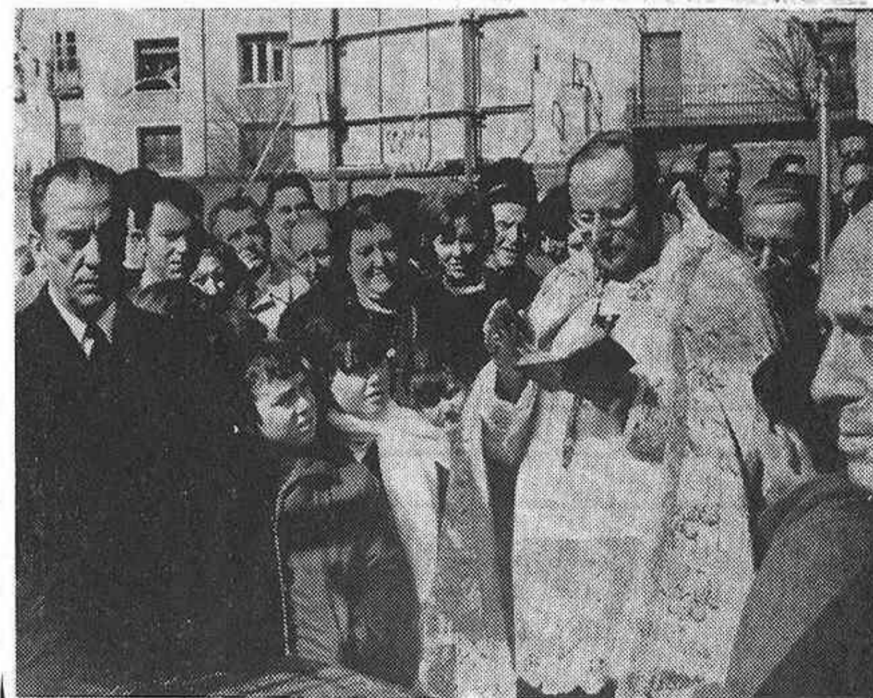
La ceremonia de bendición

A continuación hizo uso de la palabra el señor Egido Aguilar, al-