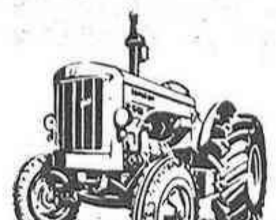
R-545 - 77 CV HMA