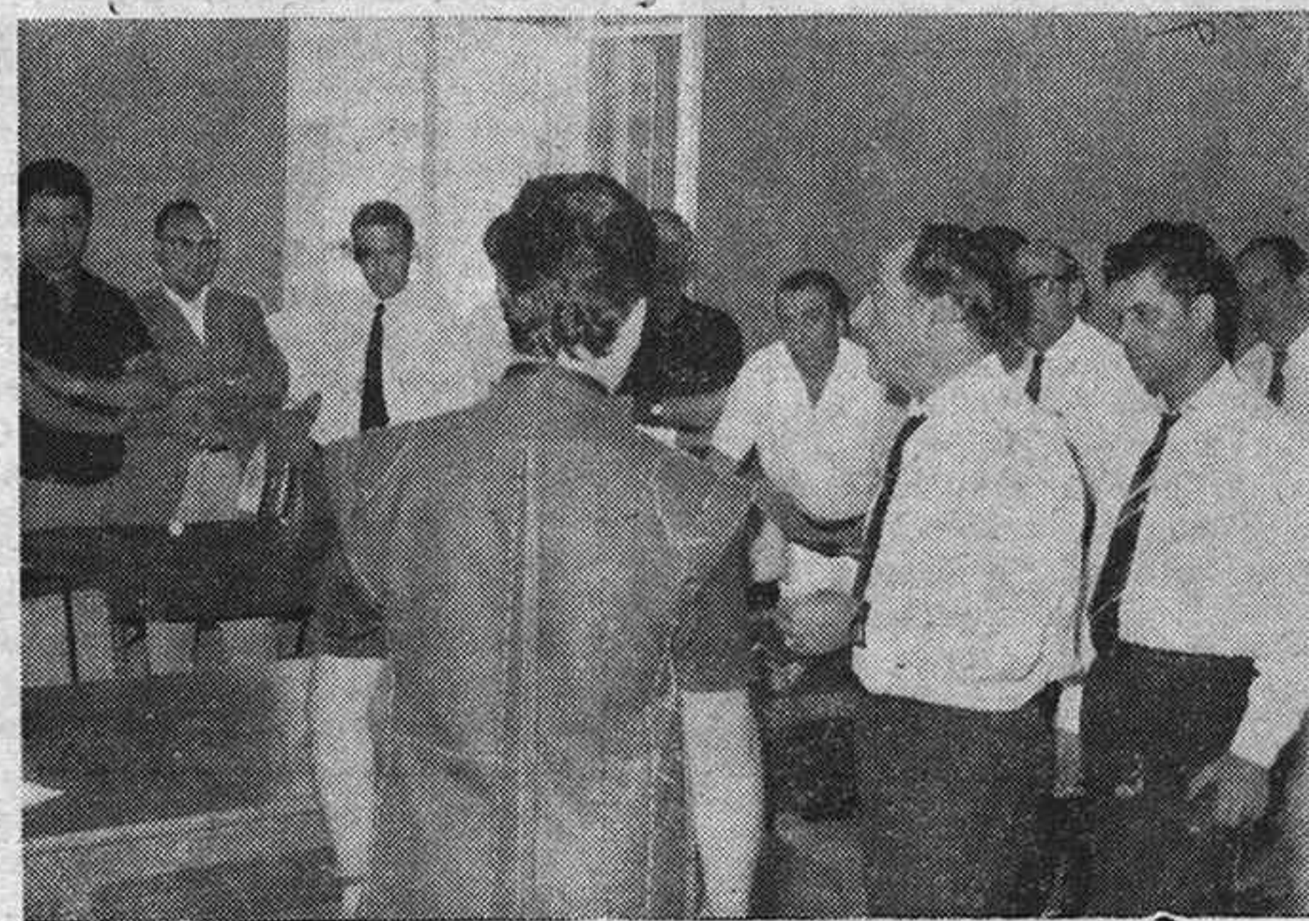
Reportaje gráfico LOPEZ PALACIOS