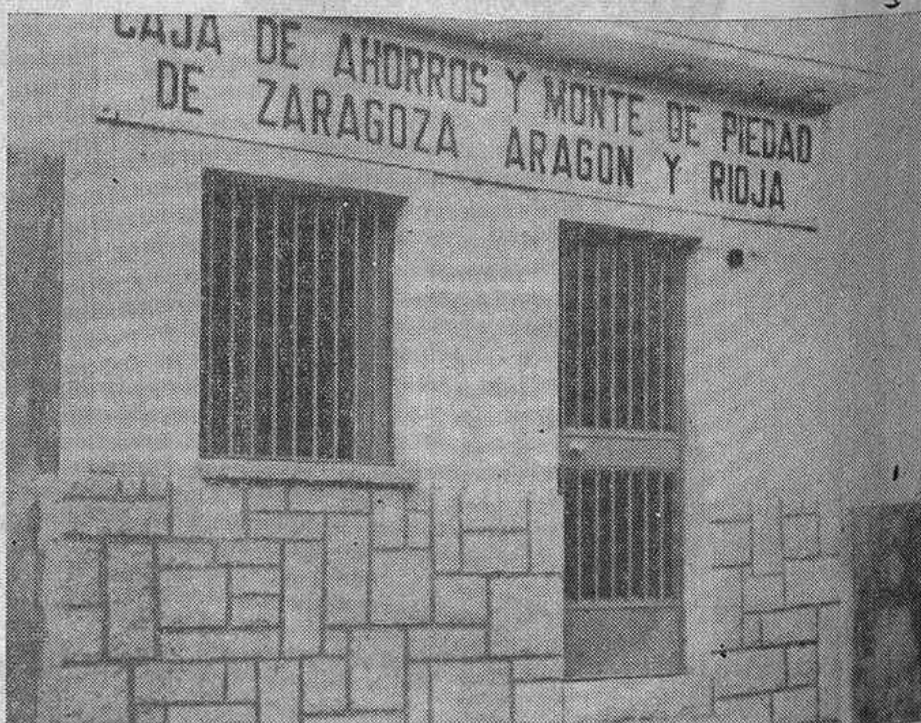
UCEDA: Una Oficina más en la provincia, cuya inauguración tuvo lugar el día 28 de junio de 1968 con toda solemnidad