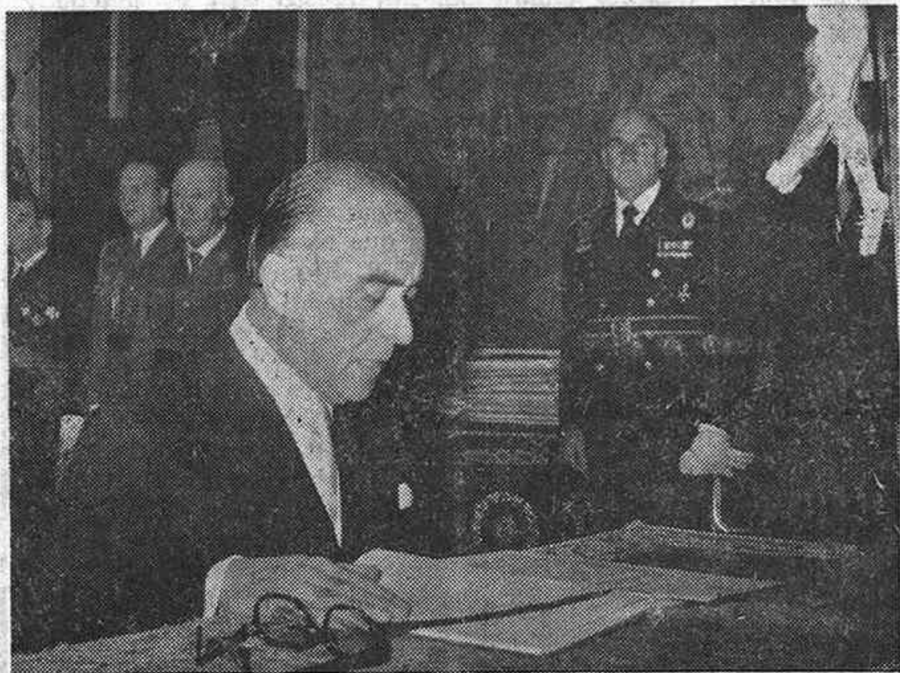
Nuestro ilustre paisano, en el momento de jurar su cargo de ministro de la Gobernación y vicepresidente primero del último Gobierno de Franco.

Hizo el ofrecimiento de ambas distinciones el señor Lozano, quien, después de aludir a la historia del nacimiento de la provincia y a sus distintos avatares, se refirió al despegue de la ciudad, principalmente desde la