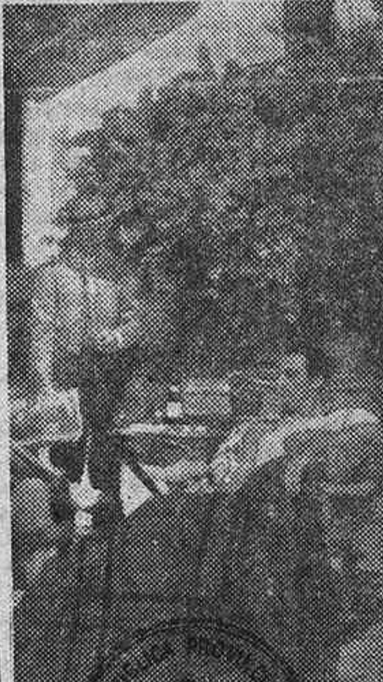
Escena de la gran película española "Brindis a Manolete", que próximamente será estrenada en una sesión diaria en el cine madrileño

Si haces uso indebido de los cupos, simulas contratos, falseas las cifras de declaración de cosechas o adquieres clandestinamente productos, se te podrán retirar los cupos de reserva concedidos