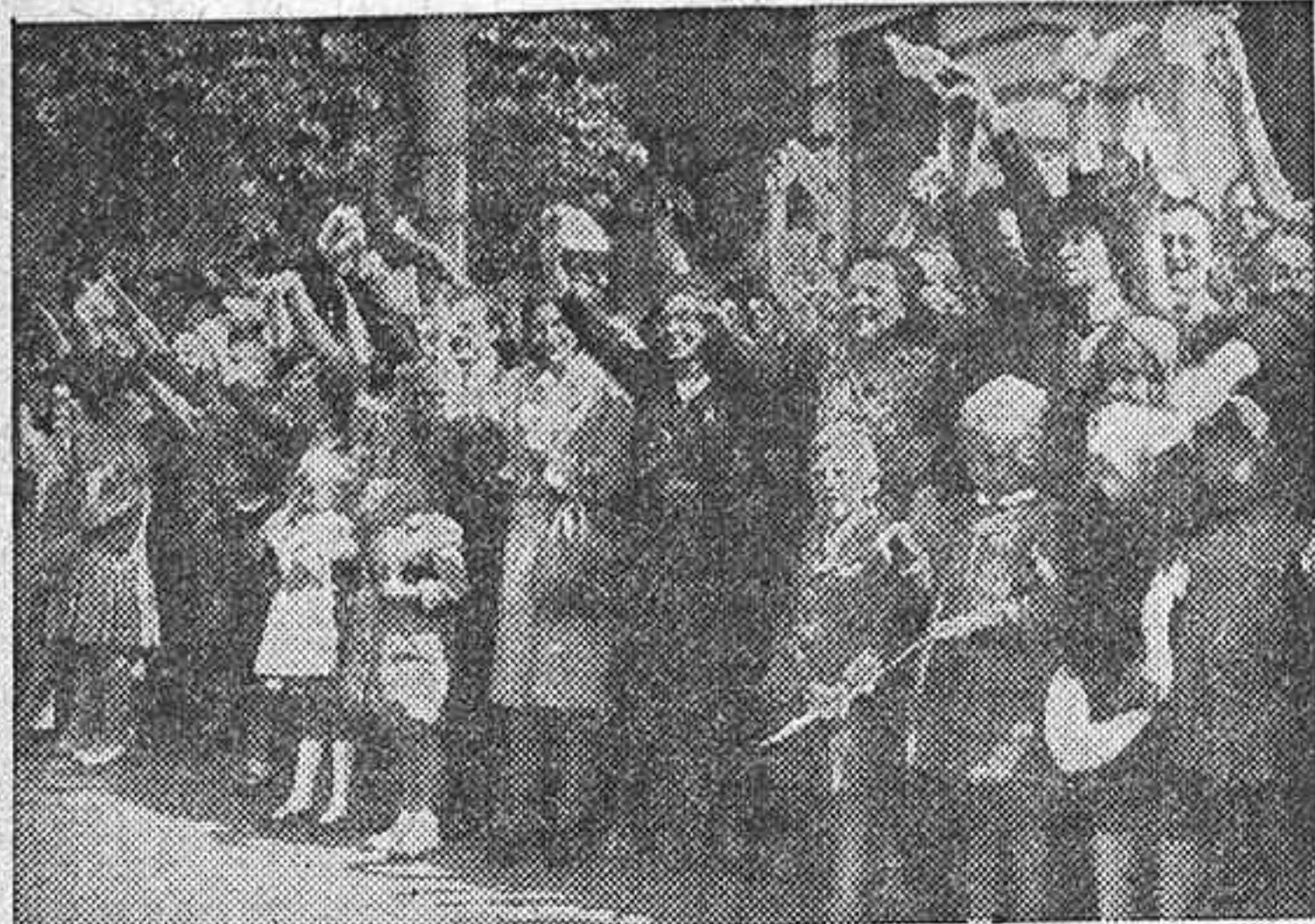
Hace unos meses, y en las calles de Praga se manifestaron las juventudes católicas checoslovacas, como aparece en esta foto. Hoy... esas mismas juventudes existen, y algún día sacudirán el yugo comunista

Por las calles sólo transita la Policía dirigida por los comunistas