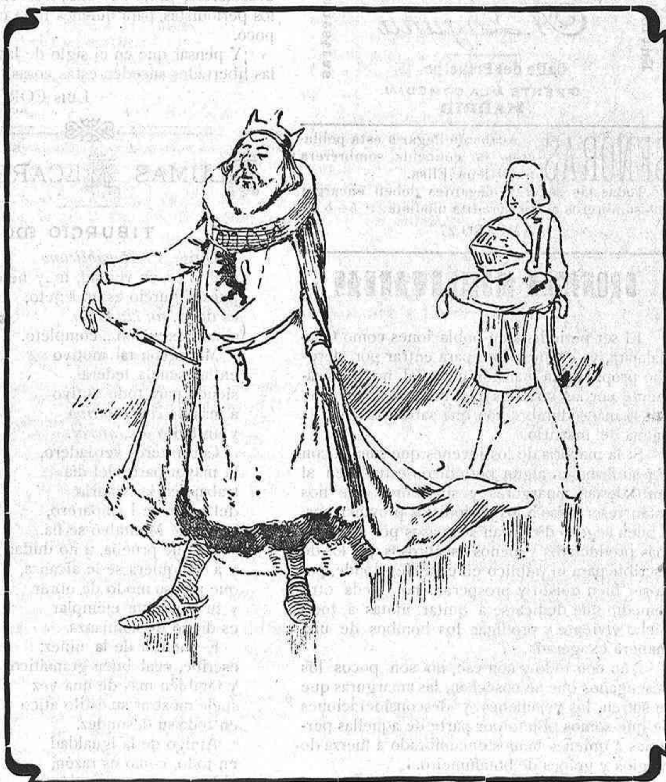
El señor Feudal