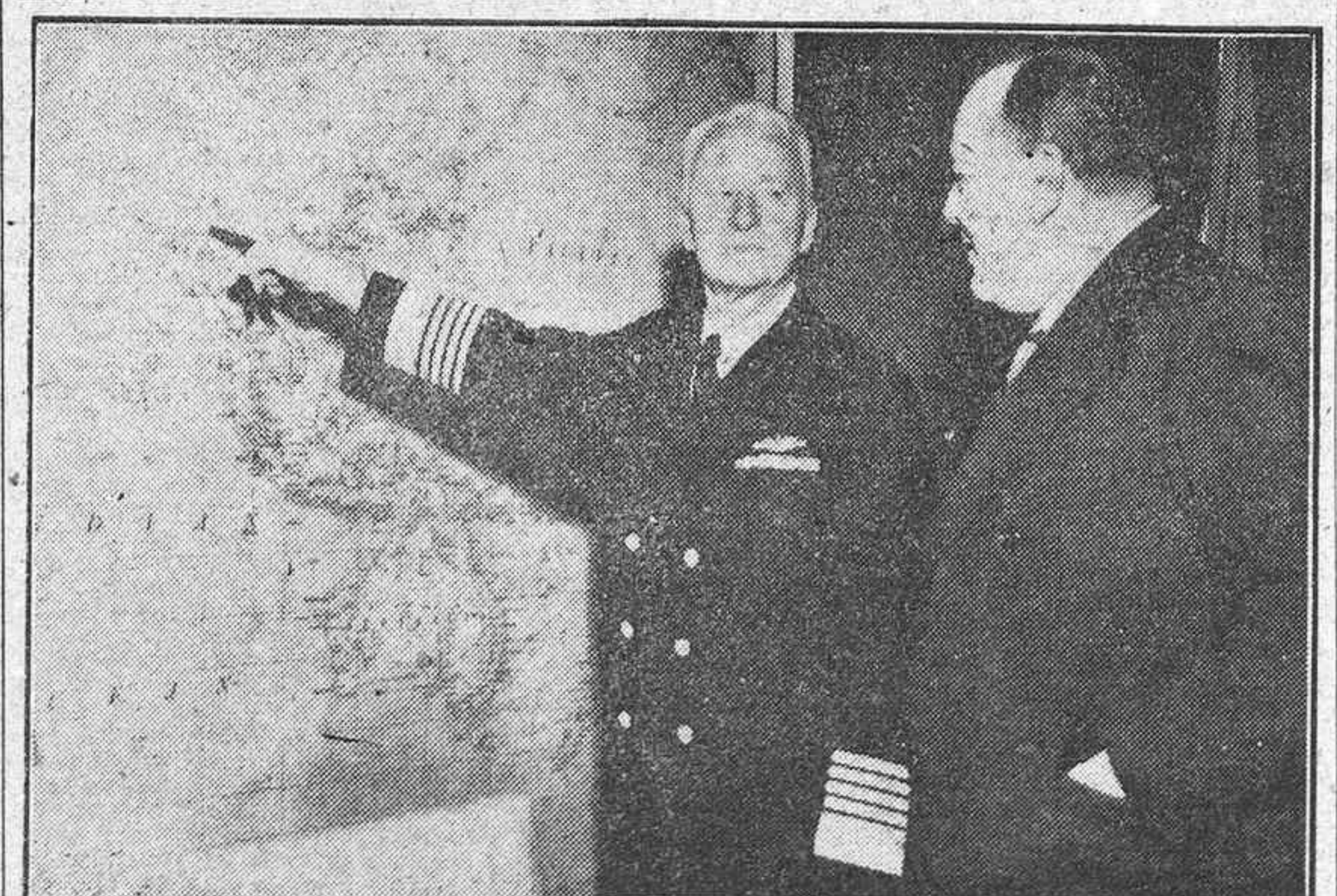
EL ALMIRANTE CHESTER NIMITZ JEFE DE LA FLOTA NORTEAMERICANA EN EL PACIFICO DURANTE LA ULTIMA GUERRA, QUE HA SIDO NOMBRADO ADMINISTRADOR DEL PLEBISCITO PARA JAMMU Y CACHEMIRA, MUESTRA SOBRE EL MAPA A TRYGVE LIE, SECRETARIO GENERAL DE LA O. N. U., LA ZONA QUE BAJO LOS AUSPICIOS DEL ORGANISMO INTERNACIONAL TENDRA UN PLEBISCITO IMPARCIAL Y LIBRE. EL PLEBISCITO DETERMINARA SI AMBOS PRINCIPADOS HABRAN DE UNIRSE AL INDOSTAN O AL PAQUISTAN