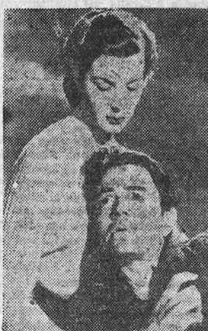
James Mason y Kathleen Ryan en la maravillosa película de Chamartín "Larga es la noche", triunfante en las pantallas del mundo y que en breve admiraremos en nuestra capital