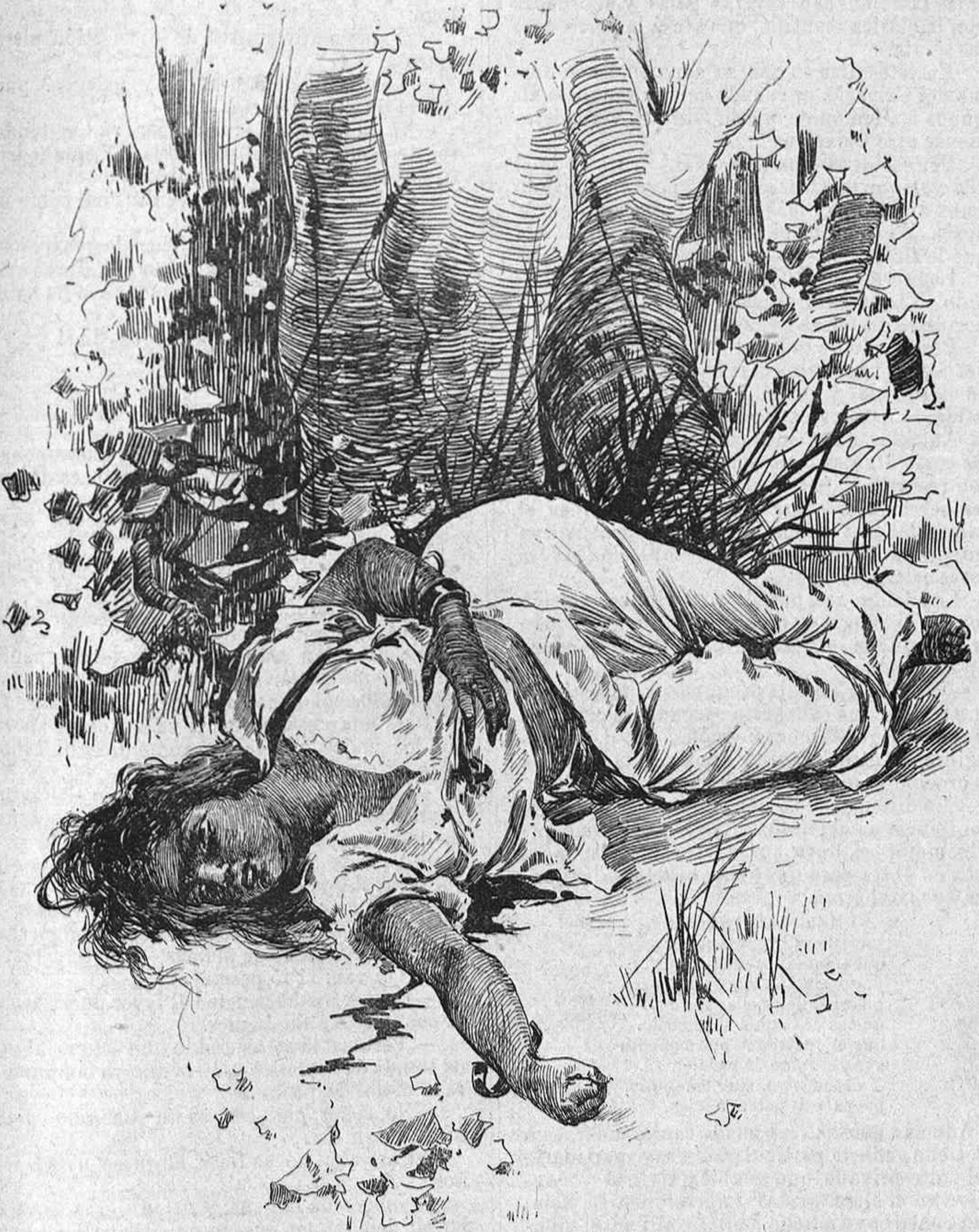
UNA BALA PERDIDA