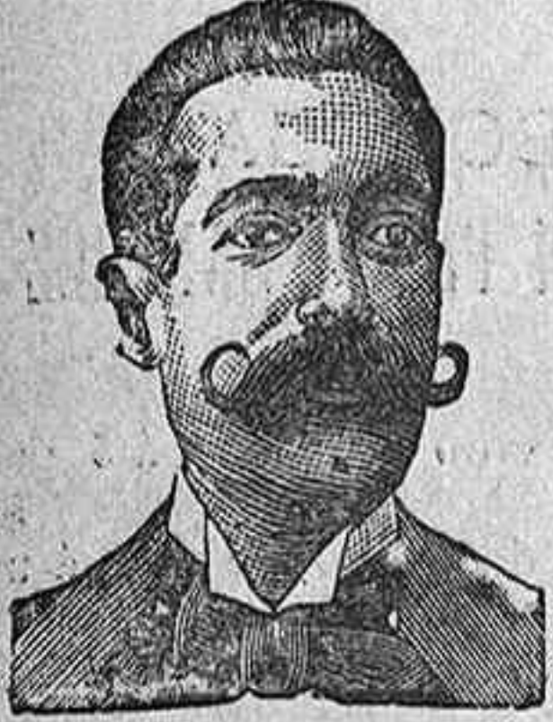
A. SALVATI COSTANZI CALLE DIPUTACION 435 BARCELONA