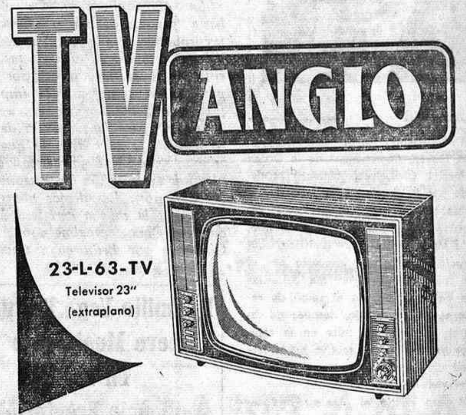
23-L-63-TV Televisor 23" (extraplano)