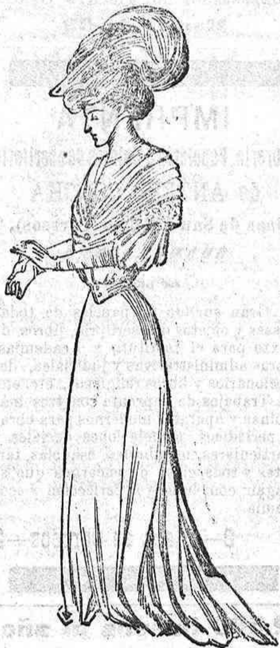
Traje para verano.—De crespón de la China. Cuerpo blusa con un plisado formando esclavina y bordado. Manga ancha hasta el codo. Cinturón de seda con dos botoncitos y falda con vuelo.