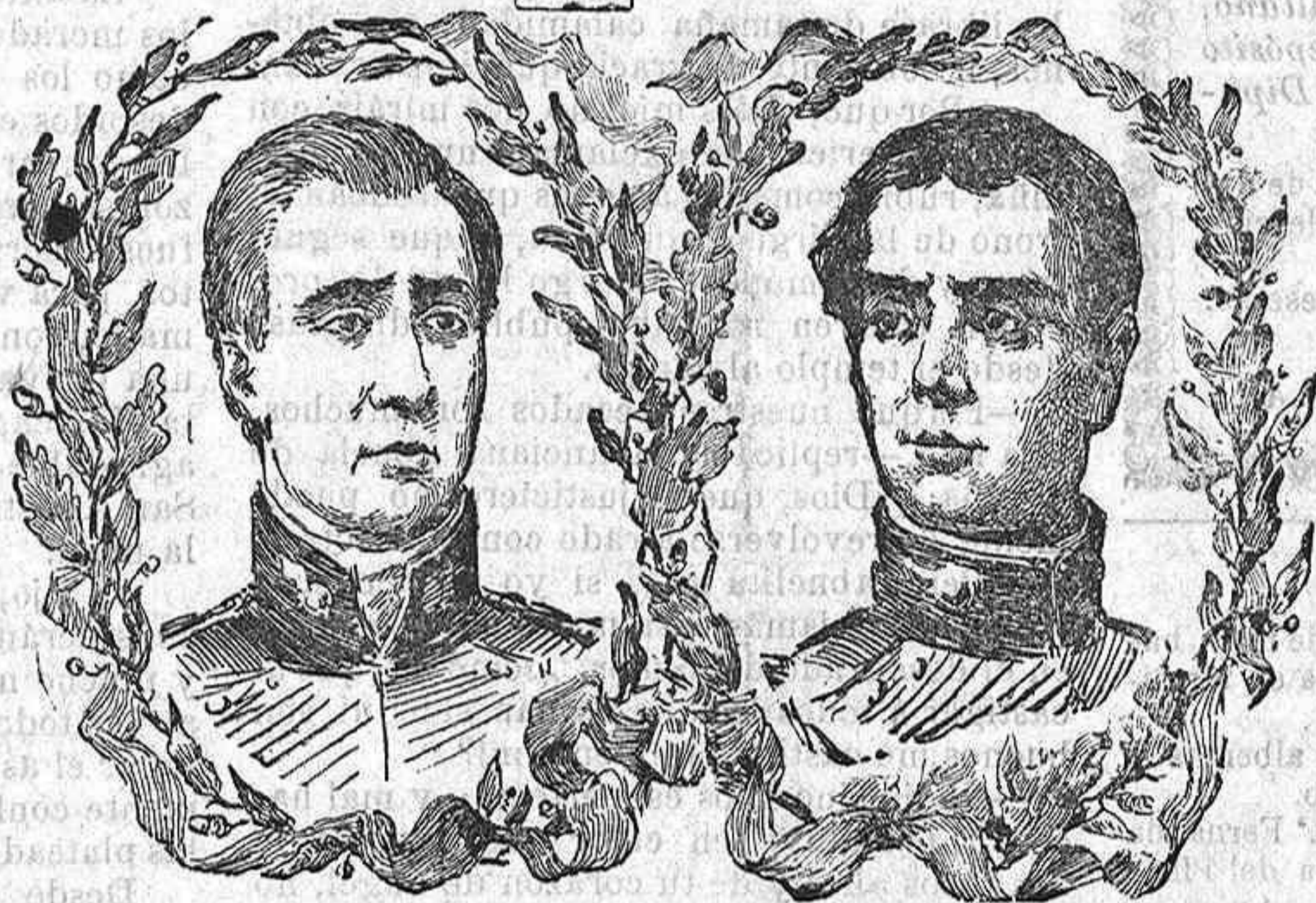
DAOIZ Y VELARDE