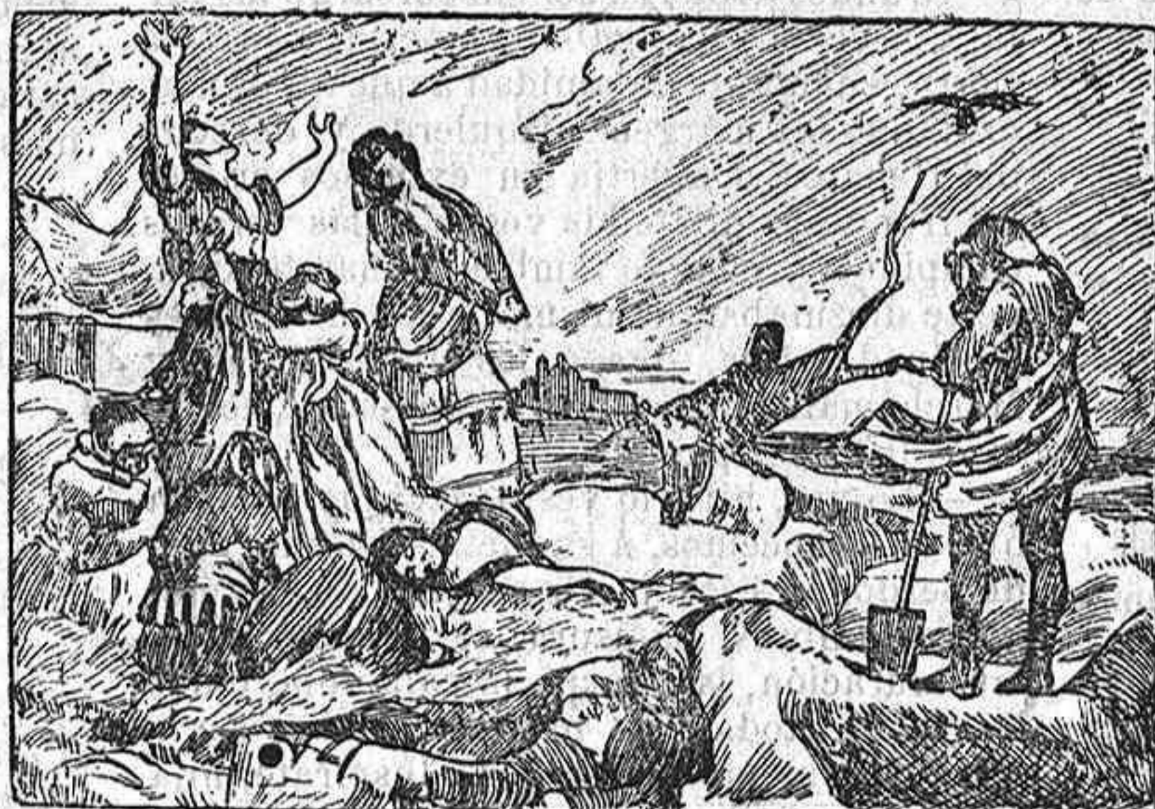
EL 3 DE MAYO DE 1808 (Cuadro de V. Palmaroli).