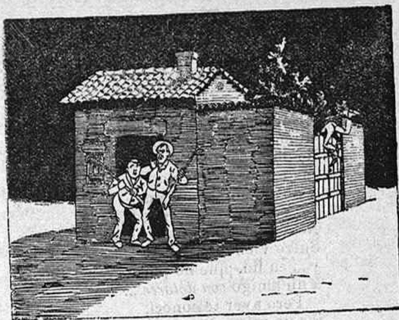
2.—Lo que es hoy no se nos escapa.