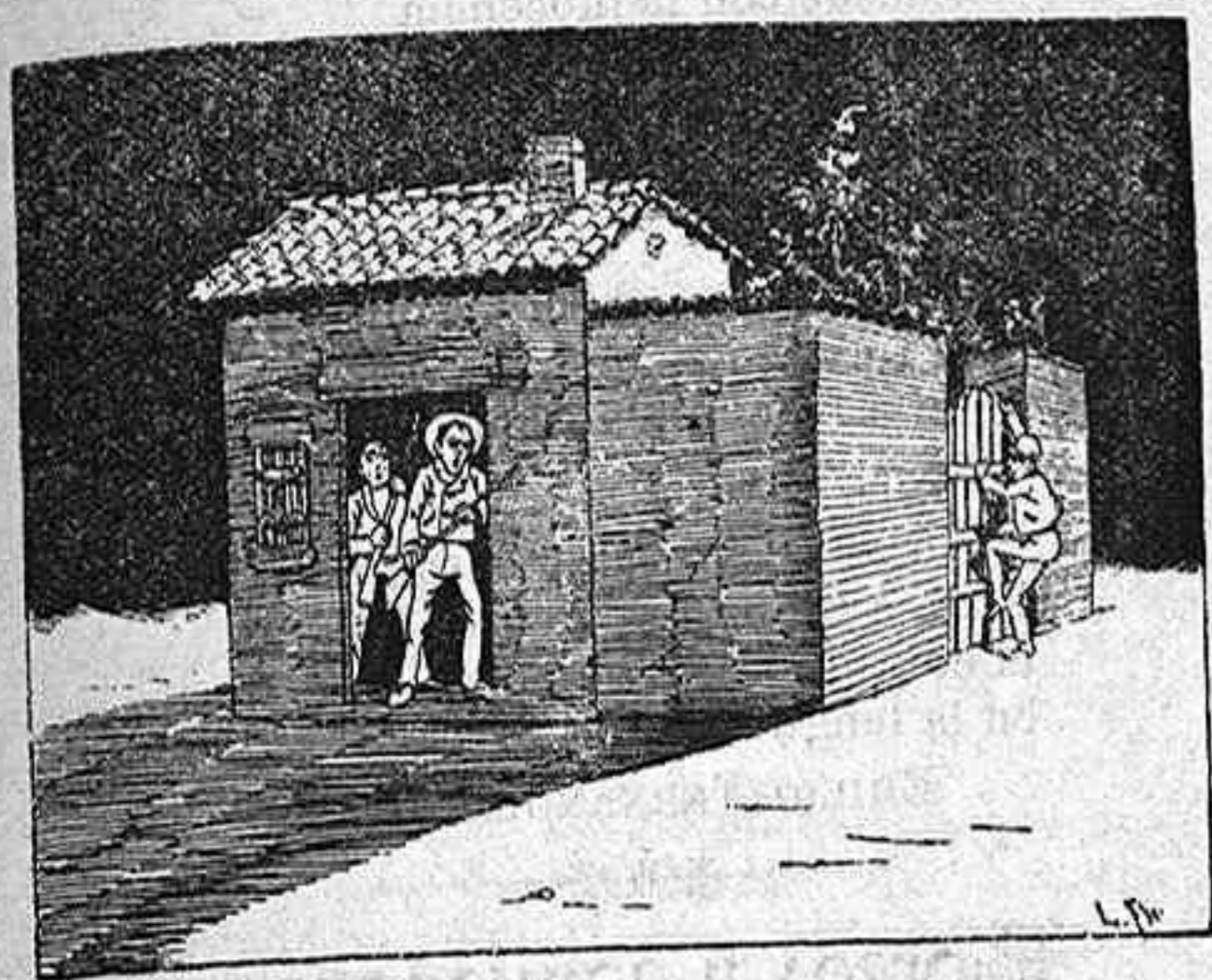
1.—Ya está ahí. Procuremos no espantarlo.