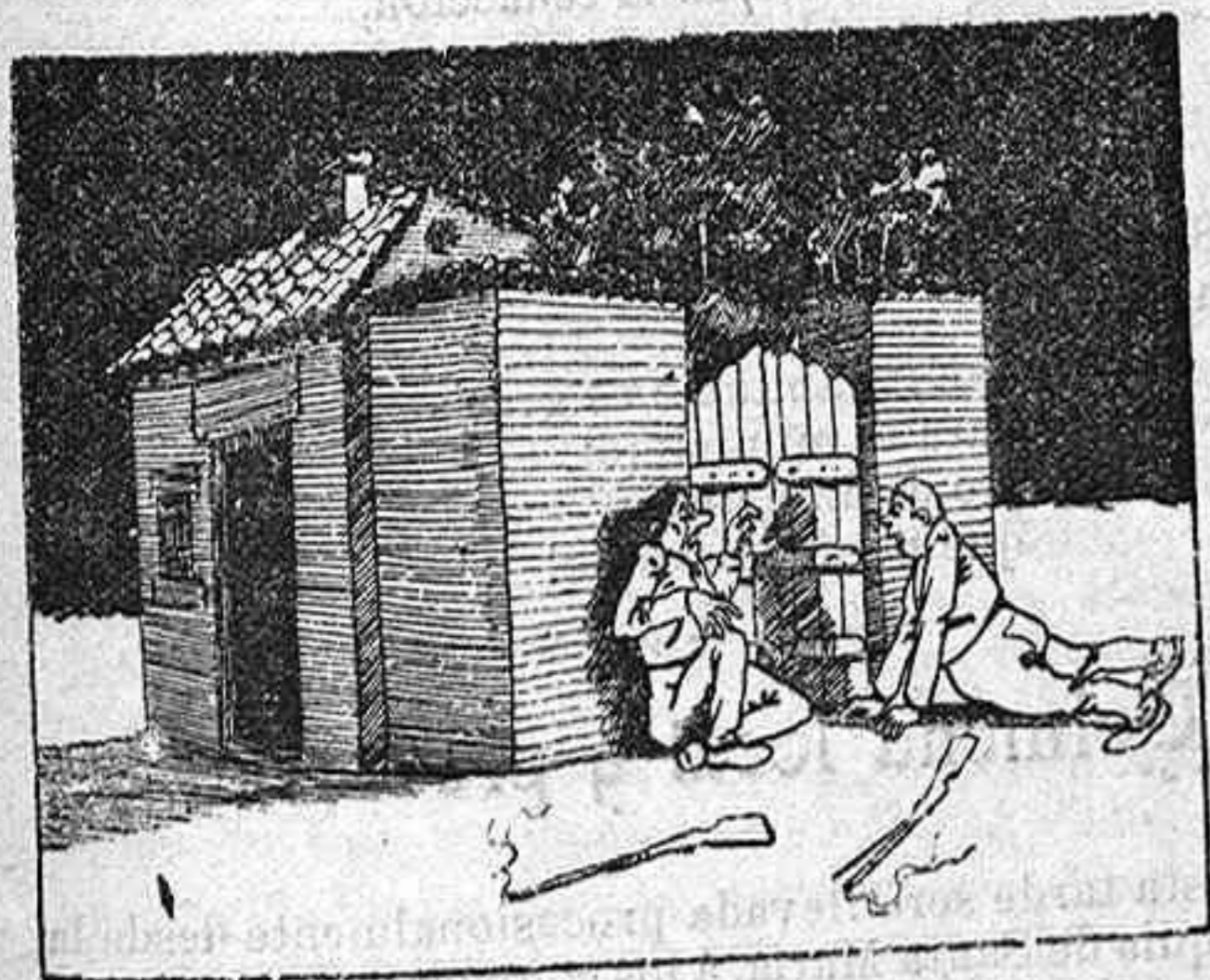
7.—¡Cómo! ¿Eres tú?