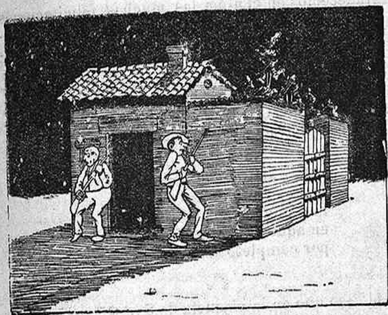
3.—Tu por la derecha y yo por la izquierda.