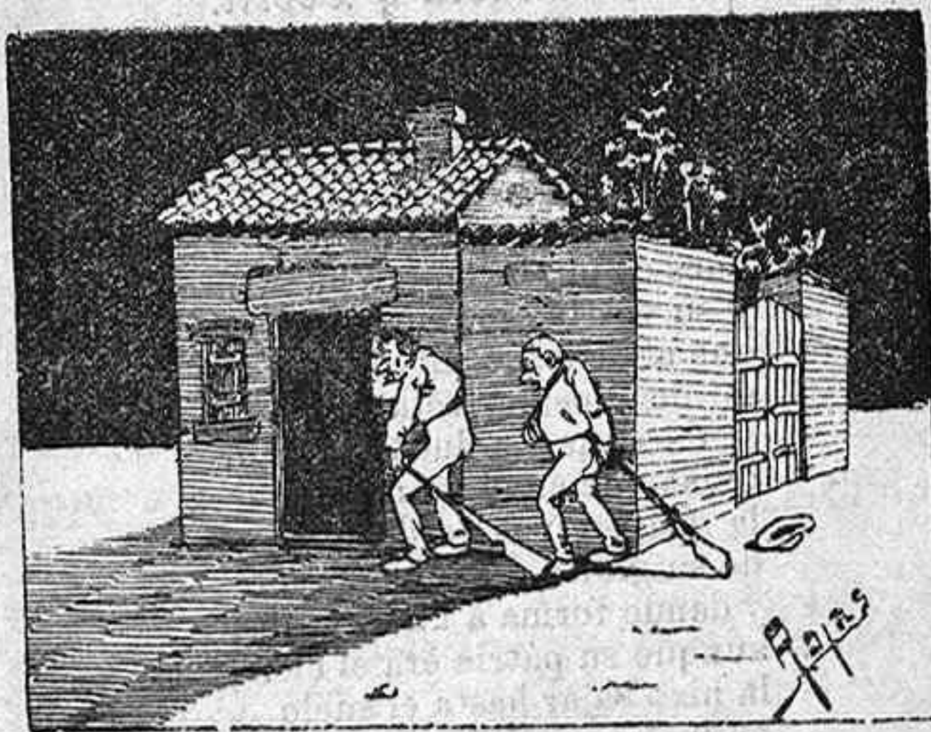
8.—Pues también se nos ha escapado hoy.