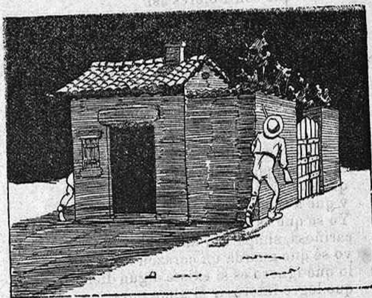
4.—Eso es; y lo pillamos entre dos fuegos.