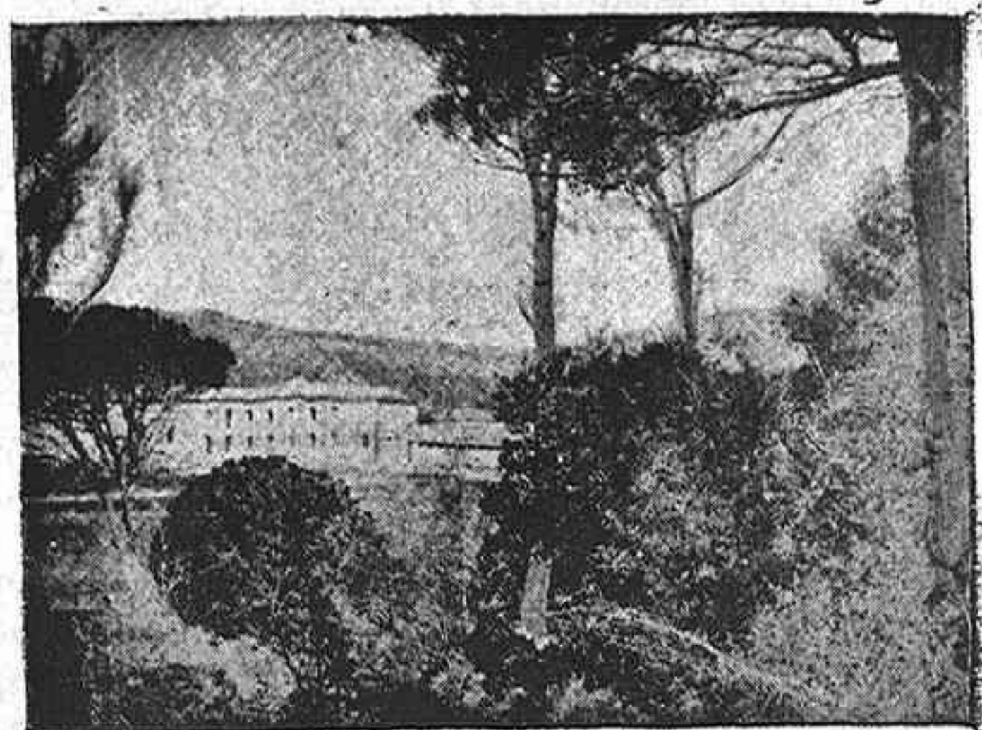
Caserío de Anguix, visto desde el Piñonar.