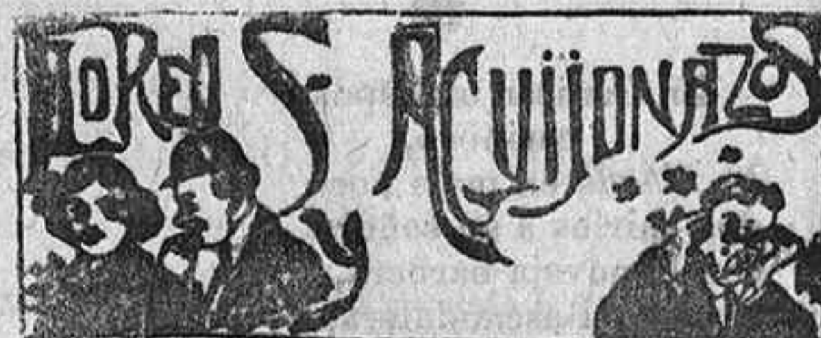
Serpentinas y confetti

Hasta el jueves, día 26, a las seis de la tarde, se admiten en la Secretaría de este círculo proposiciones, por separado, para el concurso del servicio de aubigú y suministro de confetti y serpentinas con motivo del baile que se celebrará en el teatro Principal el sábado 28 del corriente.