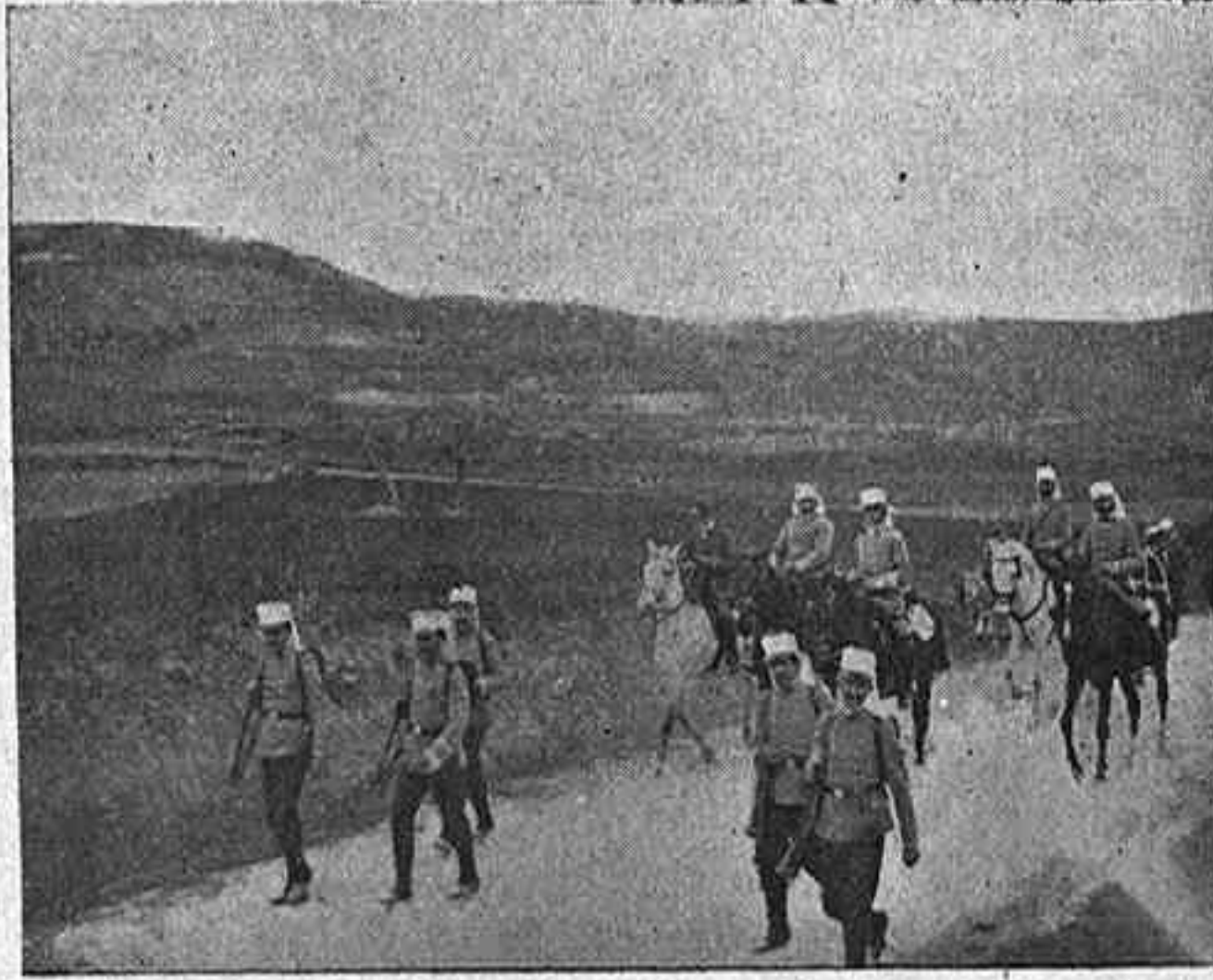
EN COLUMNA DE VIAJE

Trascurre media hora; parece que allá, a lo lejos, se ve tropa; es necesario tomar precauciones; un oficial con ocho alumnos, se adelanta a reconocerlos, y visto que no nos quieren molestar , vuelve todo el mundo a sentarse; nos dicen que es el décimo montado de Artillería, de guarnición en Vicálvaro, que se halla de prácticas.