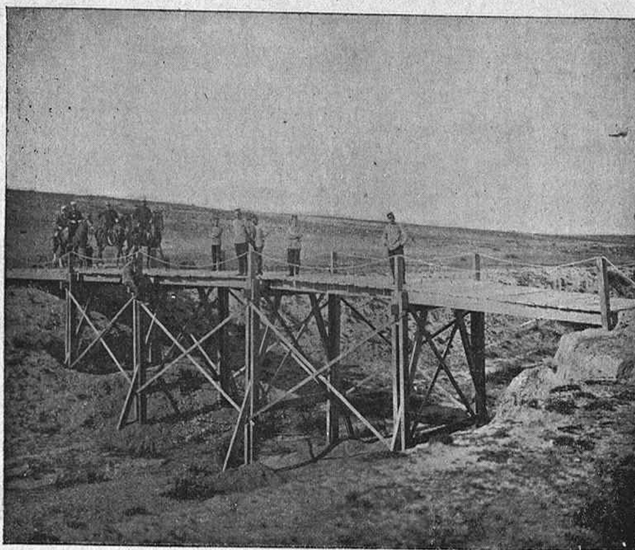
PUENTE DE CIRCUNSTANCIAS CONSTRUÍDO POR LOS INGENIEROS