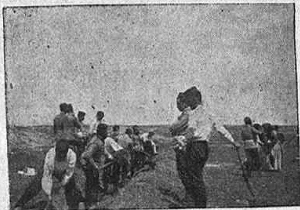
SECCIÓN DE ZAPADORES

llegando; la animación fué creciendo; el conjunto de ómnibus con particulares, entre los que abundaba el bello sexo, oficiales de todas graduaciones y armas á caballo, ciclistas, automóviles, fotógrafos, etc., desfilaba hacia el Campamento, pareciendo imposible que éste pudiera alojar tantos miles de personas; suenan los clarines y trompetas; las músicas baten marcha; á lo lejos se ve una polvareda que avanza, se oye el galopar de muchos caballos.... Ya se distinguen bien las figuras; ¡el Rey! Viene en un precioso y potente potro; su traje es de Alumno de Infantería con guerrera gris, ros con funda y cogotera; saluda constantemente y sonriendo; en un landeau van S. M. la Reina y SS. AA. RR.; la Infanta Isabel guía cuatro hermosos caballos; luego siguen los Generales y sus Ayudantes, un sinnúmero de Jefes y Oficiales de todas armas y buena suma de particulares: todos á caballo entran en el Campamento.