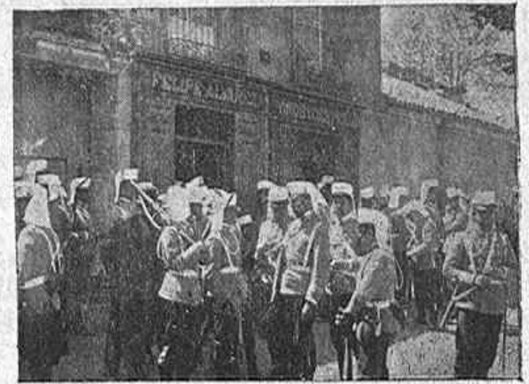
DESCANSO EN LAS VENTAS

Cuando ya estaba formada la columna para marchar, pasó el puente la formada por los Alumnos de Sanidad Militar, y en su seguimiento marchó la de Ingenieros con las precauciones necesarias, pues se suponía que los que ocuparan el Campamento se opondrían a que se entrase en él; así sucedió, en efecto, pues antes de llegar al punto de reunión, un destacamento de Infante-