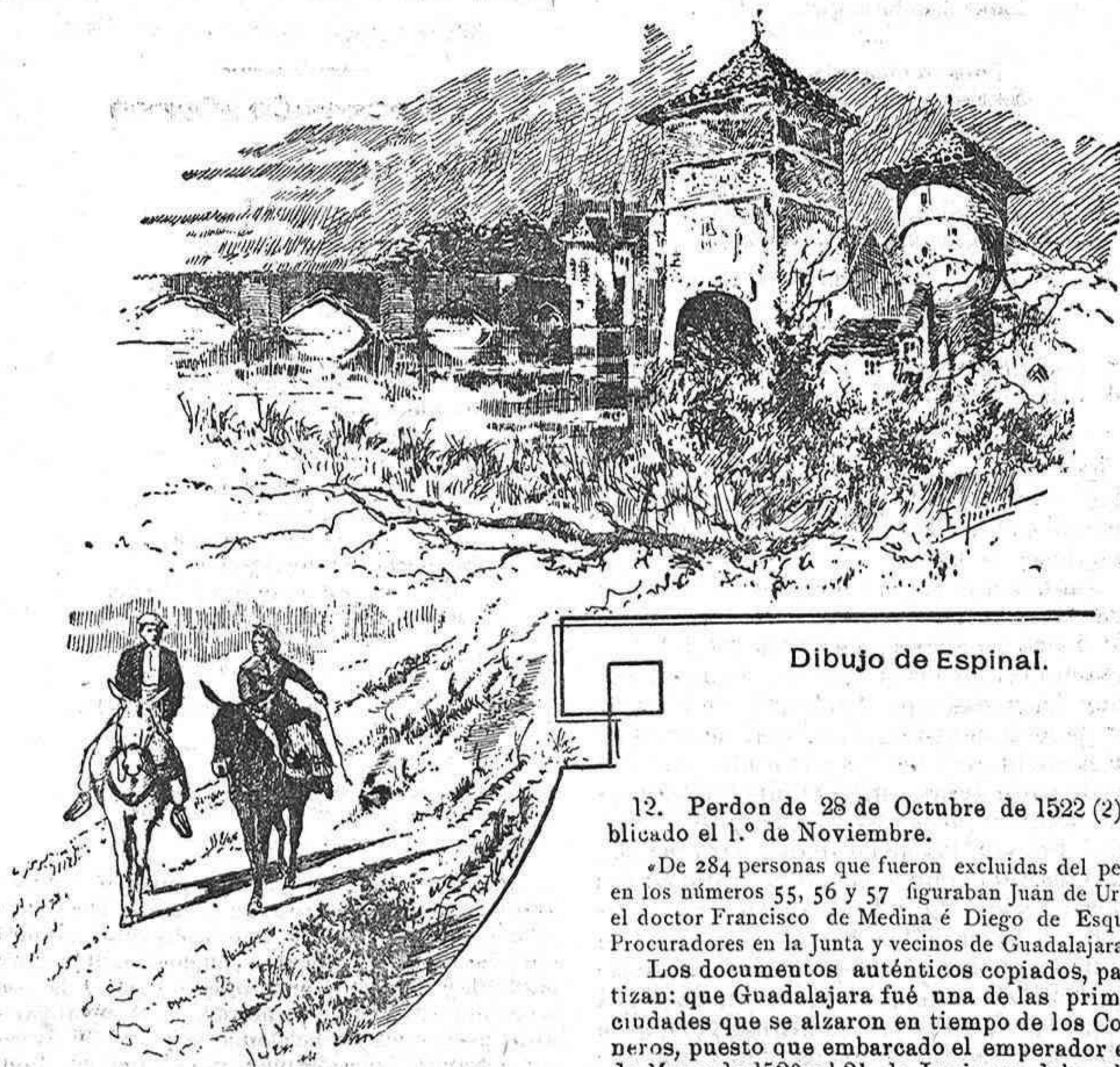
Dibujo de Espinal.

12. Perdon de 28 de Octubre de 1522 (2) publicado el 1.º de Noviembre.