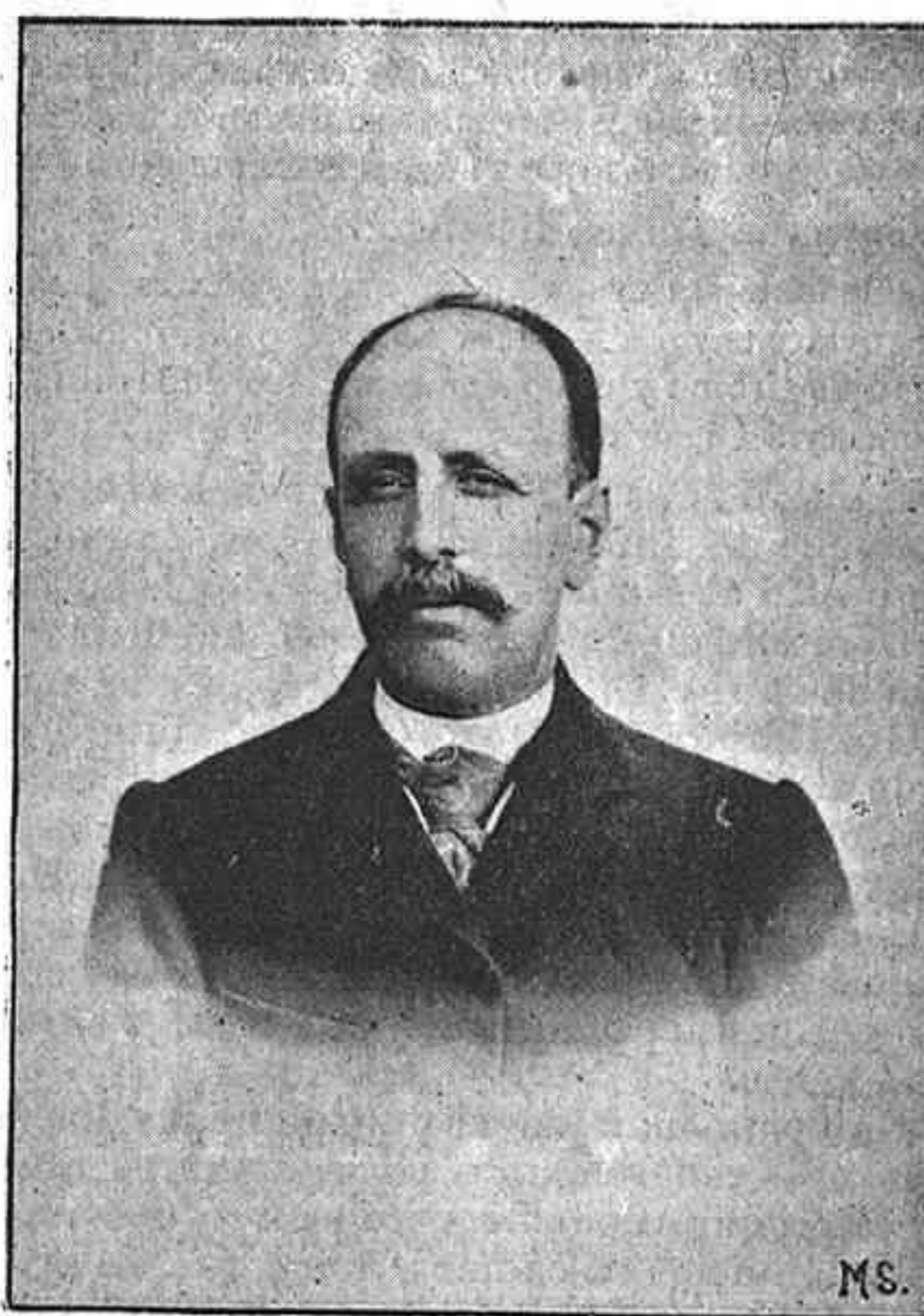
Alcalde de Guadalajara