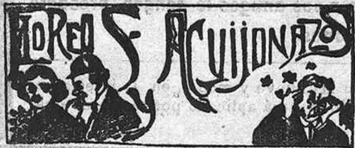
El programa de festejos

En honor de la Virgen de la Antigua, Patrona de mi pueblo, unas fiestas sublimes, portentosas, organizó el Concejo, que traerán de seguro el día ocho miles de forasteros, como van en octubre a Zaragoza y a Alovera en enero.