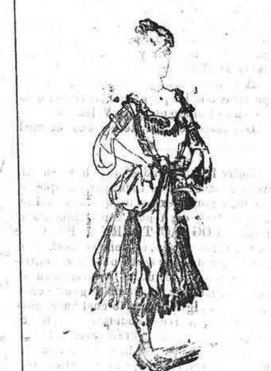
Disfraz de Narciso