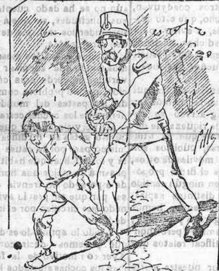
Tratamientos de la polioxa a nuestros vendedores cuando el número pida...

Si se desea recibir bajo sobre por su INDOLE ESPECIAL, debe remitirse al Administrador un sello de 15 céntimos para su franqueo como carta. También puede pedirse LA AVISPA y el CATALOGO RESERVADO en casa de nuestros correos autorizados, si no se quiere escribir a la Administración.