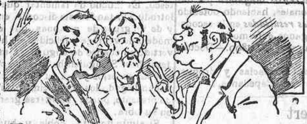
Abominan a nuestros libros... pero los compran.

Todas las personas de gusto, curiosas é ilustradas deben pedir al Director de LA AVISPA , apartado núm. 8, MADRID, un ejemplar que se remite gratis y franqueado. Esta Revista Enciclopédica Popular publica recreaciones científicas, recetas de cocina, repostería, confitería, vinos, licores, pinturas, barnices, betunes y