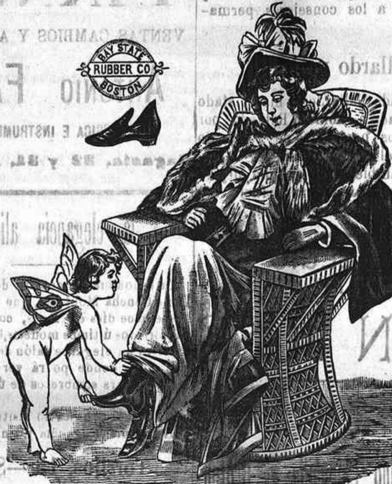
De venta en los principales comercios.