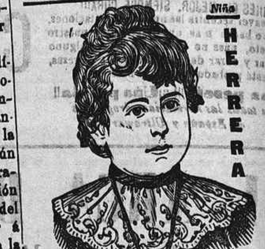
Barcelona 30 de Noviembre de 1901.