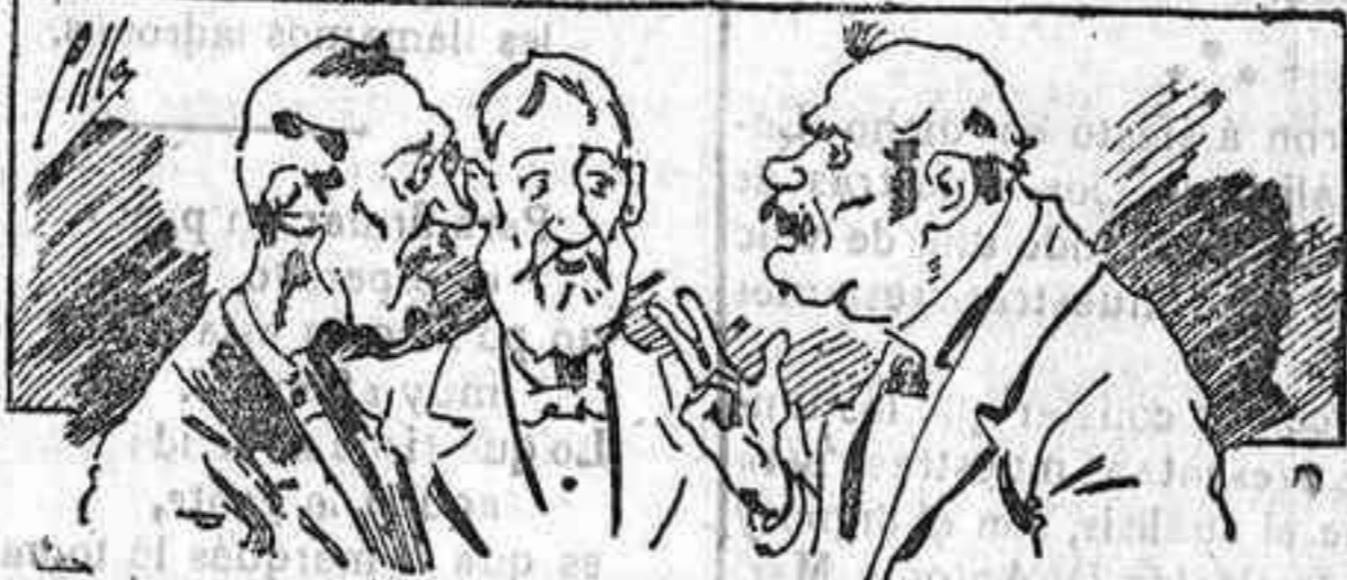
Abominan á nuestros libros... pero los compran.

Todas las personas de gusto, curiosas é ilustradas deben pedir al Director de LA AVISPA, apartado núm. 8, MADRID, un ejemplar que se remite gratis y franqueado. Esta 'Revista Enciclopédica Popular publica recreaciones científicas, recetas de cocina, repostería, confitería, vinos, licores, pinturas, barnices, betunes y fórmulas para toda clase de industria, y cuantas noticias y conocimientos puedan ser beneficiosos. Cuenta además con buenos grabados, parte literaria excelente; da regalos mensuales á sus lectores con la Lotería Nacional y participaciones en la misma, á cuyo efecto compra todos los sorteos, y en una de las Administraciones más afortunadas por la suerte, billetes enteros. La suscripción y los números que se nos pidan se sirven gratuitamente á correo vuelto y franqueados, con sólo indicar el nombre y dirección de: que lo desea en sobre dirigido al Sr. Administrador de