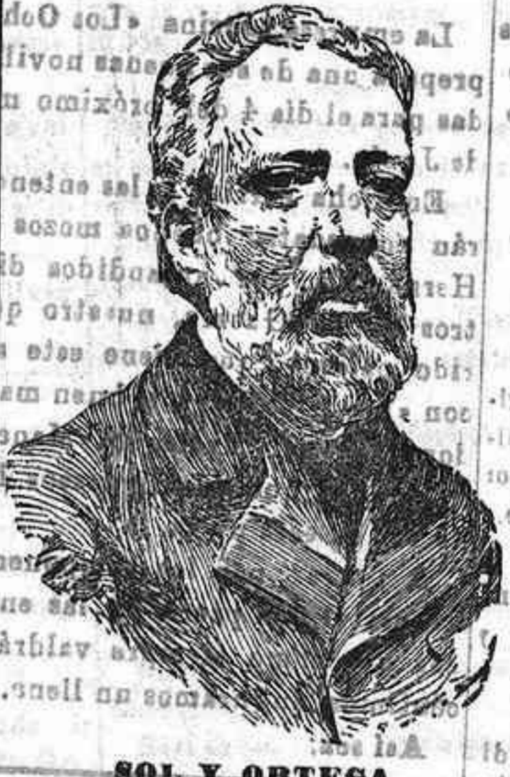
SOL Y ORTEGA

cente resulta cierta la noticia, por que motivo para que lo sea tal vez cobren.