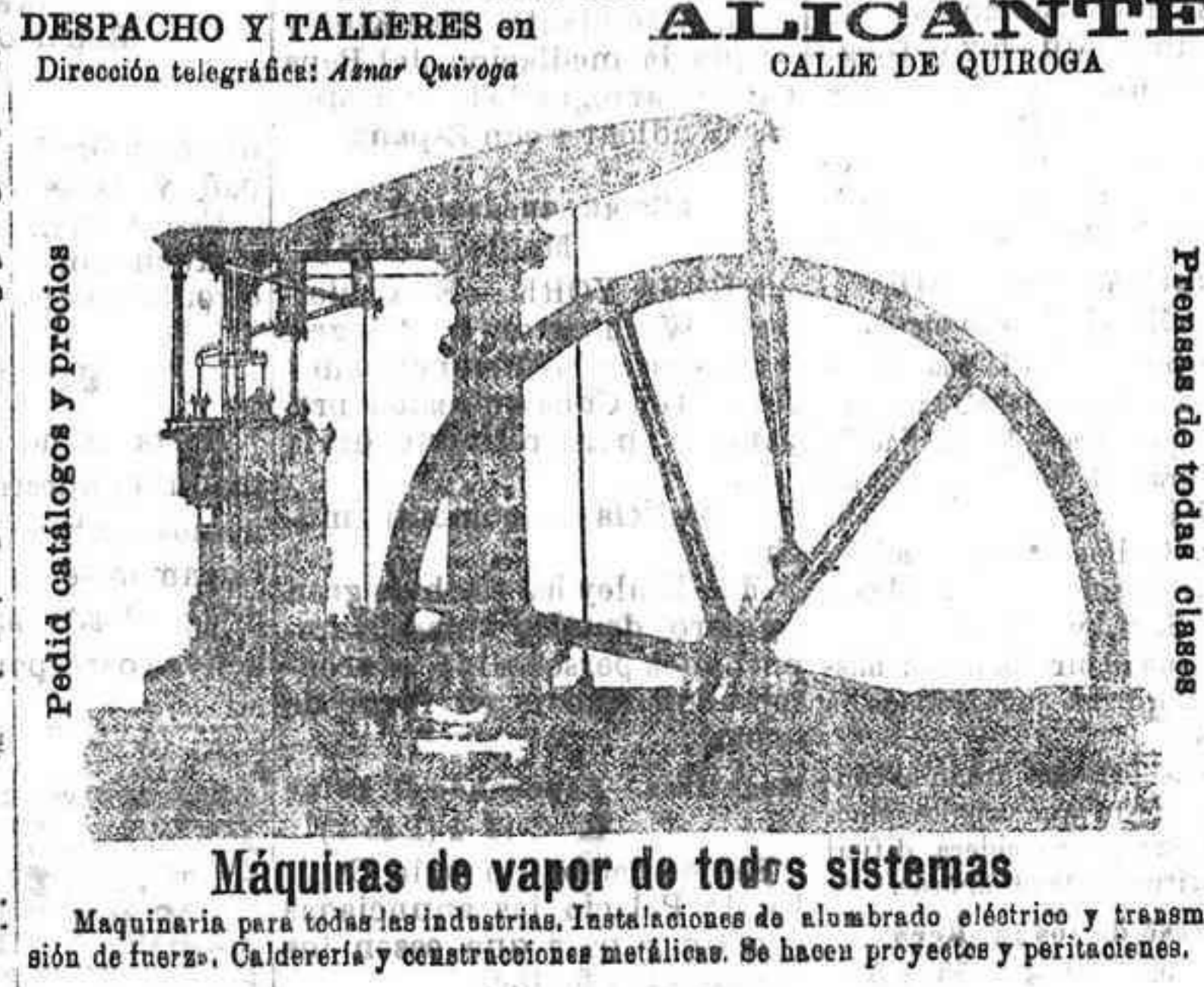
Máquinas de vapor de todos sistemas Maquinaria para todas las industrias. Instalaciones de alumbrado eléctrico y transmisión de fuerza. Calderería y construcciones metálicas. Se hacen proyectos y peritaciones.