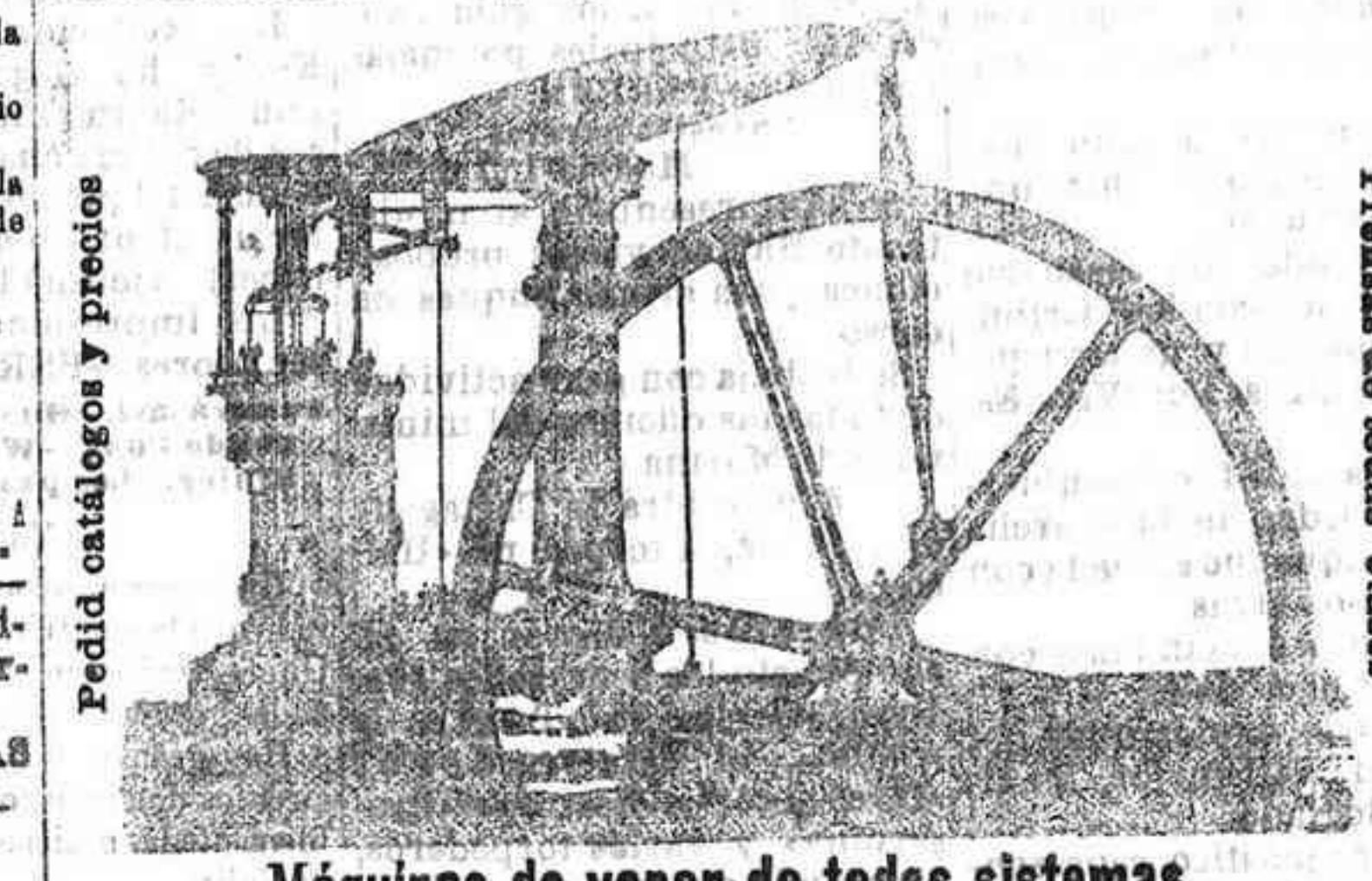
Máquinas de vapor de todos sistemas. Maquinaria para todas las industrias. Instalaciones de alumbrado eléctrico y transmisión de fuerza.

INGENIEROS CONSTRUCTORES ALICANTE CALLE DE QUIROGA