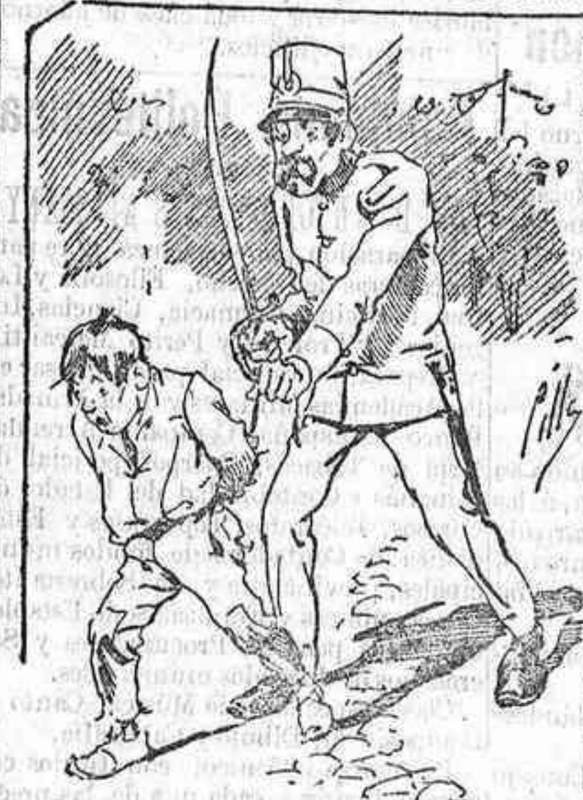
Tratamientos de la polioxia á nuestros vendedores cuando el número bica...

También puede pedirse LA AVISPA y el CATALOGO RESERVADO en casa de nuestros corresponsales autorizados, si no se quiere escribir á la Administración.