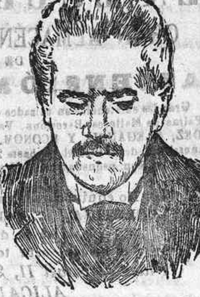
El insigne poeta y catedrático TRÓFILO BRAGA Presidente del nuevo Gobierno de Portugal

Así que haya tomado color, traeládes á una fuente y sírvase acompañado de una salsa con parte del caldo de cocción colado y mezclado con salsa provenzal.