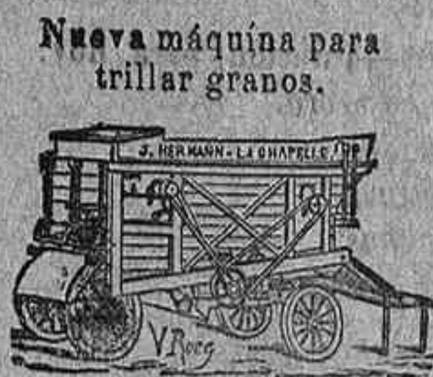
Nueva máquina para trillar granos.

Nuevos molinos de harina sobre zócalo Boffeoi de hierro.