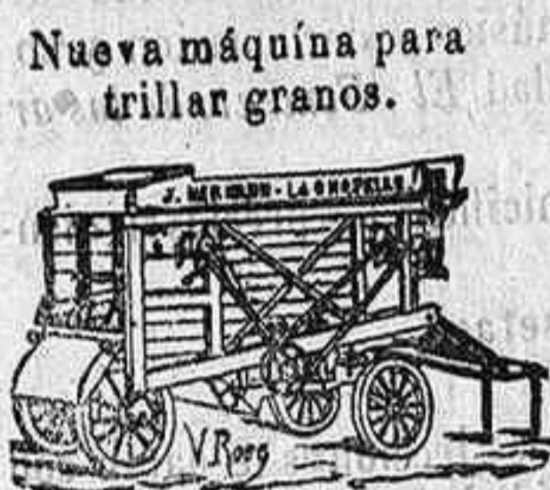
Nueva máquina para trillar granos.

Nuevos molinos de harina sobre zócalo Boffel de hierro.