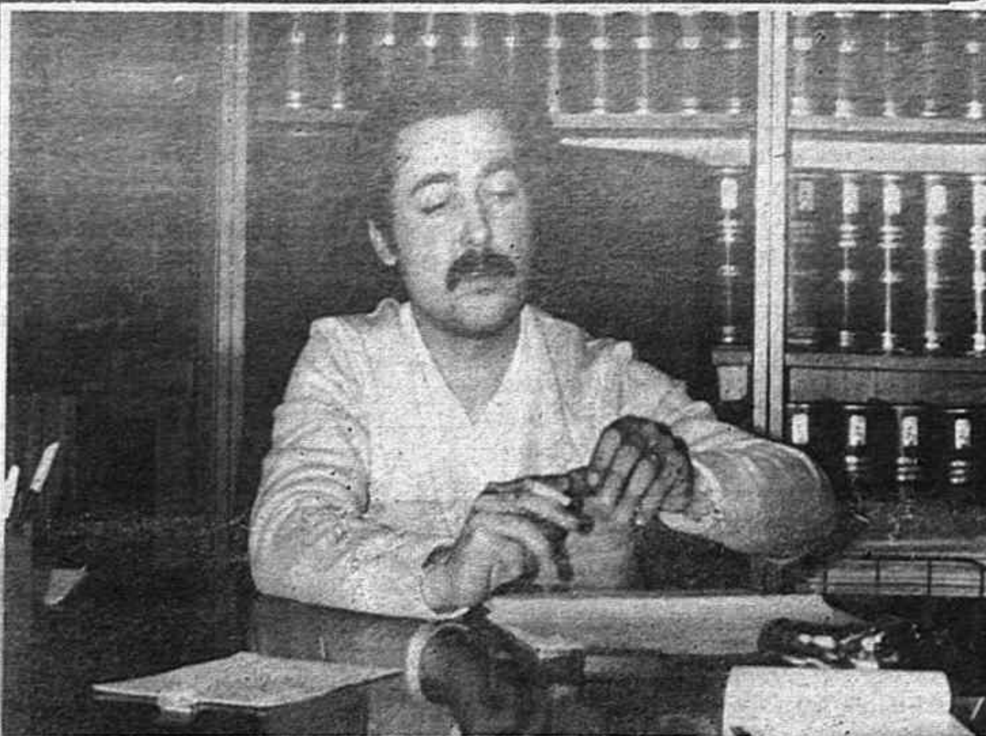
El alcalde de Albaterra a CANFALI

ESTE PAIS ESTA ENTRANDO EN UNA SITUACION UN POCO EXTRAÑA