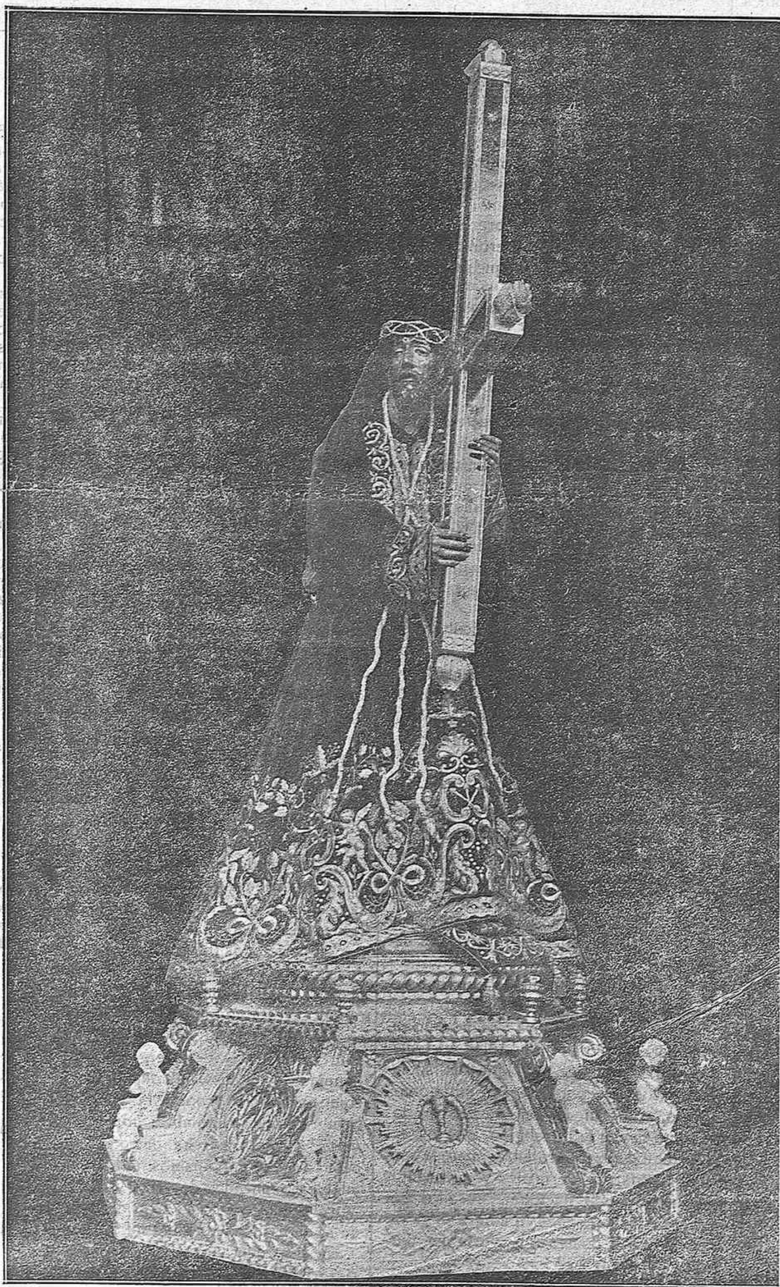
Sagrada Imagen de Ntro. Padre Jesús, que figura en las procesiones de Semana Santa, y que cuenta con un precioso altar de veneración y amor en todos los corazones oriofanos.