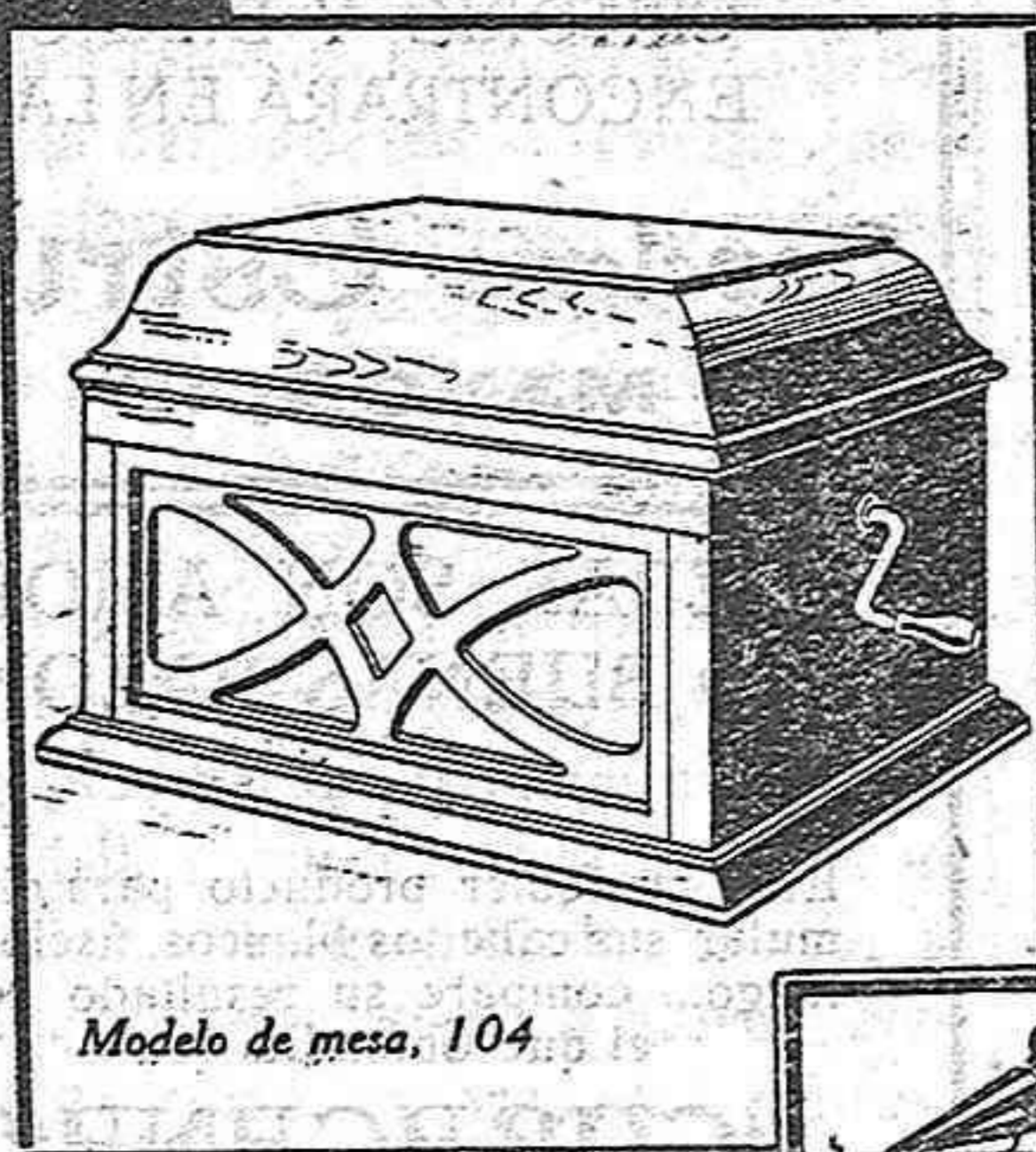
Modelo de mesa, 104

Le interesa también ver el elegante modelo de mesa: el núm. 104 «La Voz de su Amo». De condiciones reproductoras inmejorables, tiene bocina interna patentada y diafragma núm. 5. Véalo en nuestra agencia, fabricado en roble o caoba al precio de pesetas 400.