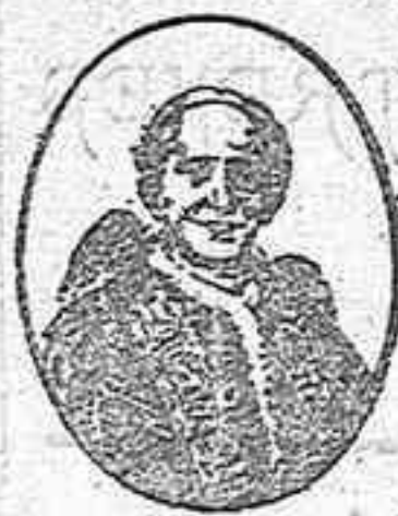
Marca regi tradas

Cerería León XIII Clases litúrgicas Garantizadas