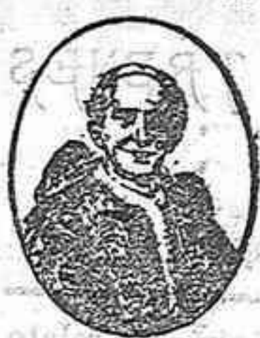
Marca regi tradas

Cerera León XIII Clases litúrgicas Garantizadas