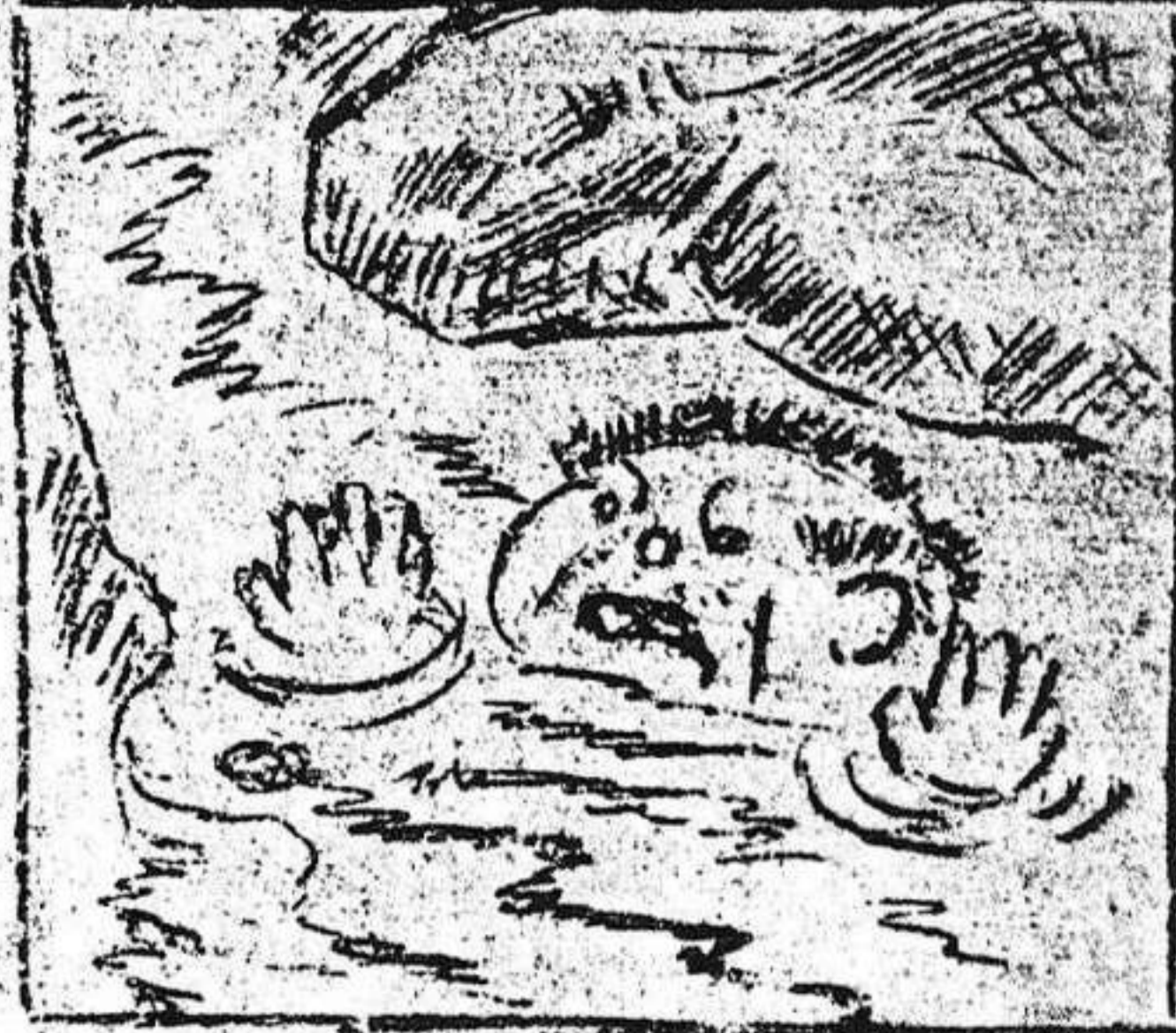
3. Al despertar de repente, se lo lleva la corriente.