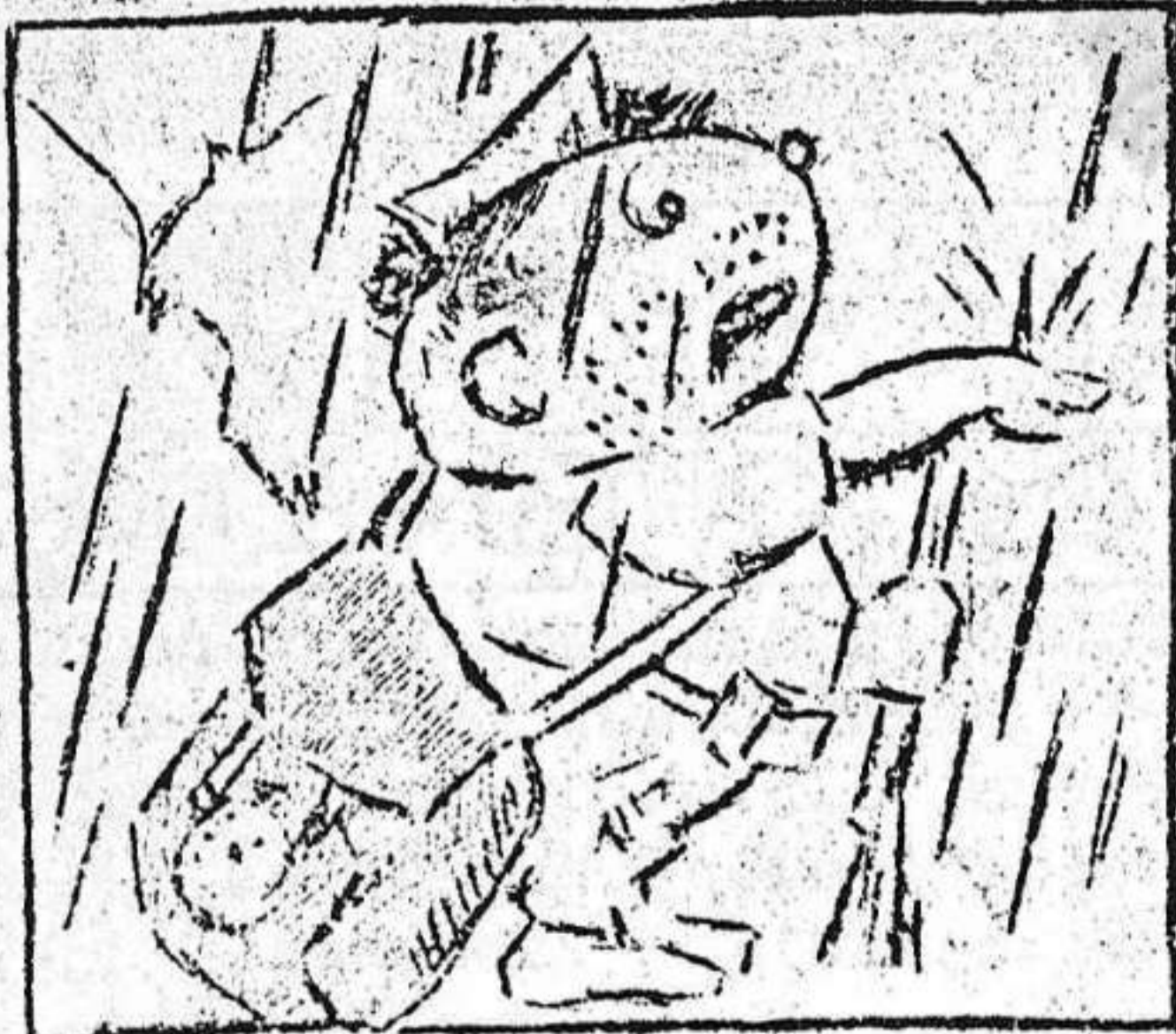
1. "MACUTO" con desparpajo, dice : "¡Llueve "pa" bajo!"

AVENTURAS DE "MACUTO", primo hermano de Canuto.- Nº 30. El diluvio